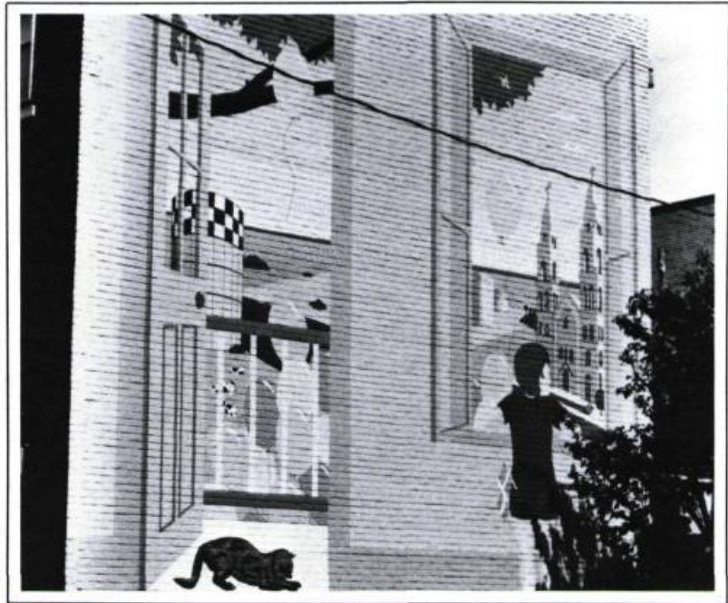
Exemple d'amélioration de la qualité de vie: la murale de l'écomusée de la Maison du Fier-Monde, rue Olivier-Robert, réalisée par les citoyens du quartier.

Le projet repose essentiellement sur la Maison du Fier-Monde; évoca-