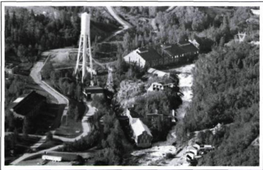
Vue aérienne du site de la pulperie de Chicoutimi.