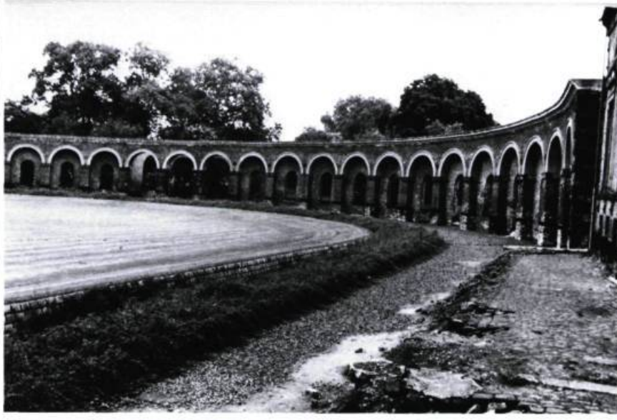
En Belgique, la cité, les ateliers et bureaux des charbonnages du Grand-Hornu, complexe industriel urbain, ont été construits par Degorge d'après les plans de l'architecte Bruno Renard entre 1820 et 1836. Organisée autour d'une cour ellipsoïdale, cette «arène» circonscrite par une double série d'arcades régulières abritait l'administration et les ateliers jusqu'à la mise à sac par des ferrailleurs après la fermeture des houillères en 1955. L'ensemble du Grand-Hornu sera désormais sauvegardé et reconverti en centre d'expérimentation et d'innovation avec bureaux, salles de recherche, etc., grâce à son acquisition par l'architecte Henri Guchoz.

Elle a lancé le défi de recueillir des données et de susciter la réflexion sur l'architecture industrielle. À souligner dans le texte, l'insistance sur la notion de site et structures qui sous-entend l'espace industriel dans son extension urbaine d'ordre morphologique (le Grand-Hornu, les Salines Royales d'Arc-et-Senan, New Lanark); en deuxième lieu, ces deux mots accentuent la nouvelle typologie: ce sont des énoncés culturels. Mais il ne faudrait pas oublier que prolifèrent des architectures qui témoignent d'une proto-histoire industrielle. Le moulin à vent ou à eau est un des premiers bâtiments qui se transforme en machine où, par exemple, la forme en tour contient la mécanique opérationnelle de l'arbre de transmission verticale. La ferme traditionnelle est le modèle sur lequel s'appuie le marchand-ferrant pour développer sa cour industrielle: espace commun autour duquel se trouvent des logements pour le patron et les ouvriers, ateliers, etc. D'autres artisans allaient reprendre ce canon d'«usine-ferme» pour établir une des premières formes de bâtiment industriel.