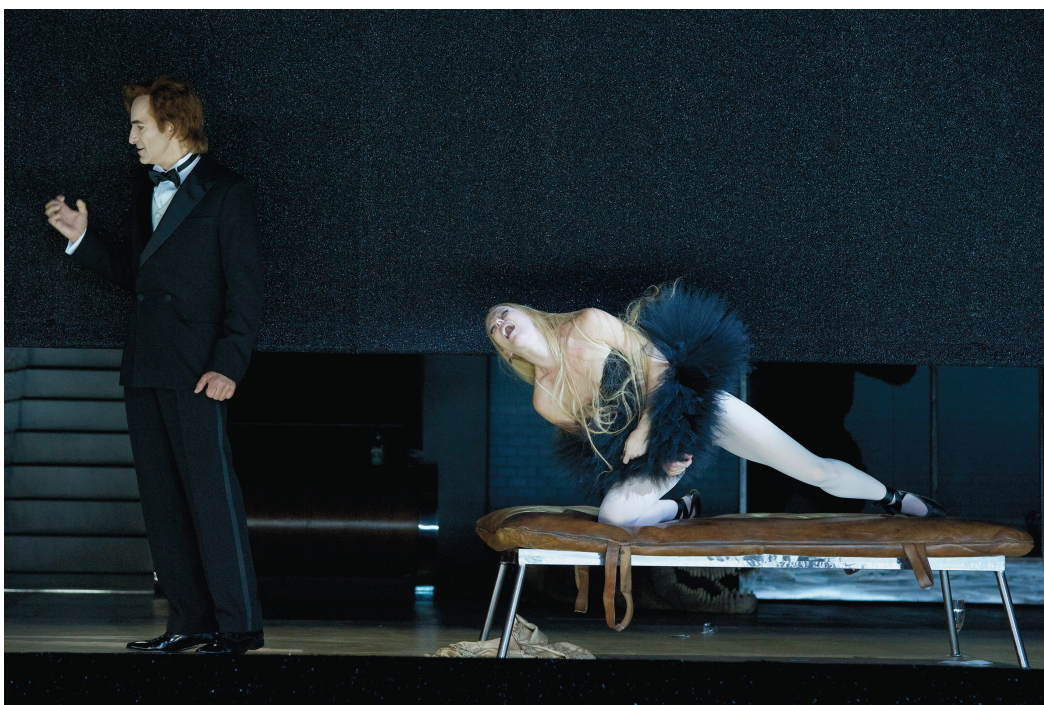
Barbara Hannigan (Lulu), dans une production de Lulu, d'Alban Berg (mise en scène de Krzysztof Warlikowski, La Monnaie, 2012). En bas, en compagnie de Dietrich Henschel (Dr Schön).