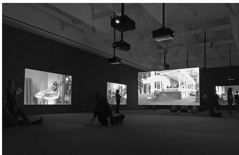
FIGURE 3 Extrait de l'installation The Visitors au MACM.

Le contexte de l'œuvre rappelle déjà la manière dont les disques sont enregistrés de nos jours : des musiciens isolés qui enregistrent leur trame séparément pour conserver le plein contrôle sur chaque instrument lors du mixage ; l'occupation de lieux mythiques à la réverbération unique et singulière ; l'aspect répétitif qui rappelle les nombreuses prises souvent requises pour obtenir la performance désirée. La dimension supplémentaire et nouvelle de cette œuvre est le mixage en temps réel ; mais elle n'existe que parce que l'image a un pouvoir d'attraction qui nous oblige à constamment réentendre la musique. Chaque déplacement, chaque mouvement de la tête augmente ou diminue la