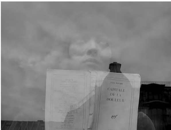
Fig. 1. Alphaville (Jean-Luc Godard, 1965).