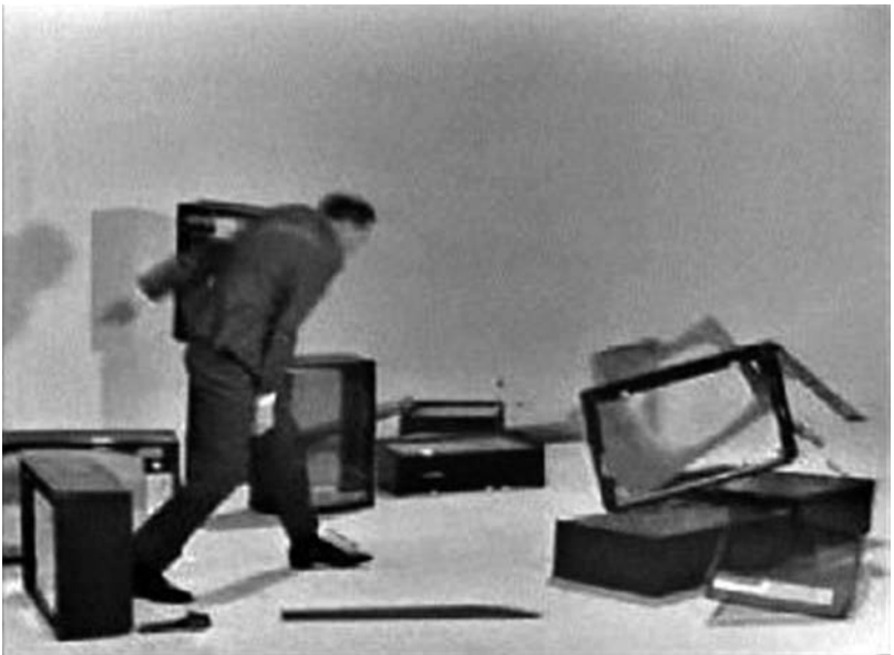
Fig. 10 et 11. Georges Bernier dans le sketch « Un jeu bête et méchant avec le Professeur Choron » de la dixième et dernière émission de la série Les raisins verts (Jean-Christophe Averty, 6 juillet 1964).