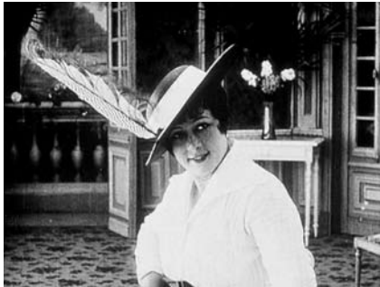
Figure 2. Aimantations à distance.