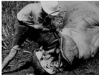
Figure 3. Intrusions de l'Ici dans l'Ailleurs : « tourisme vandale ».