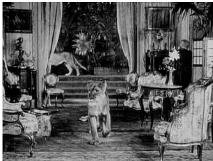
Figure 1. Reflux de l'Ailleurs dans l'Ici : la scène mondaine.