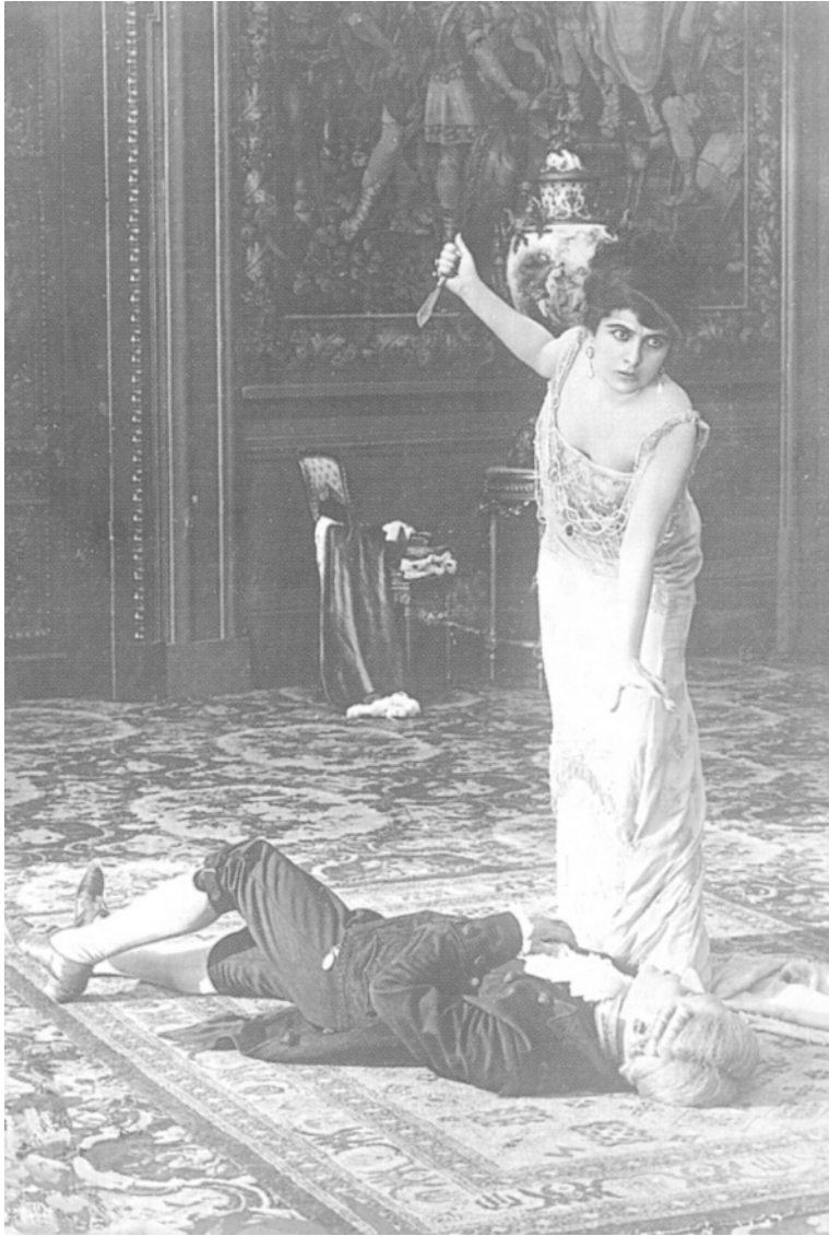
Figure 1. Tosca, ou la pose de la diva d'opéra sur scène ( Tosca , 1918)

visages des femmes dessinées par Alphonse Mucha ou Aubrey Beardsley. Dans les films muets italiens mettant en vedette des divas, la composition du plan, où la façon dont le corps est cadré est déterminante, donne aux « divines » toute leur puissance.