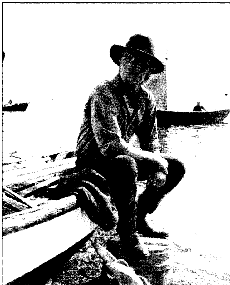
Les Fous de Bassan d'Yves Simoneau (1986)

personnage. C'est d'abord une silhouette, « la ligne générale d'un corps » comme le dit le dictionnaire Larousse. C'est une enveloppe, un contenant, sombre au demeurant et, en ce sens, difficile à décrire avec précision. S'il a de longues jambes, l'ensemble est pourtant dégingandé c'est-à-dire « disloqué dans ses mouvements et dans sa démarche » — toujours le dictionnaire ! Le nimbe du soleil l'entoure comme une auréole. Son chapeau mou cache mal un visage émacié et des yeux pâles. Sa première apparition publique a lieu dans l'embrasure de la porte demeurée ouverte de la petite église de Griffin Creek au moment où tout le village y est