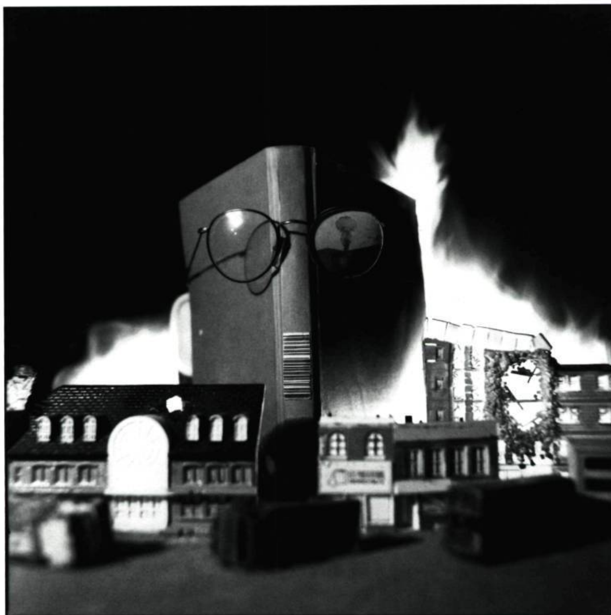
2. Phobie Enfantine (Hommage à Inoshiro Honda)