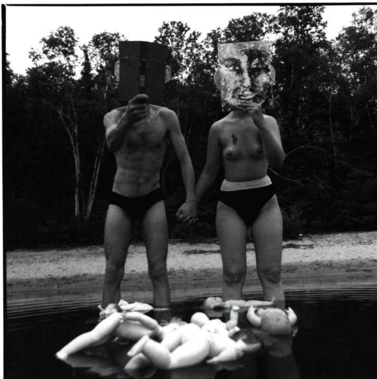
6. Bill à la plage