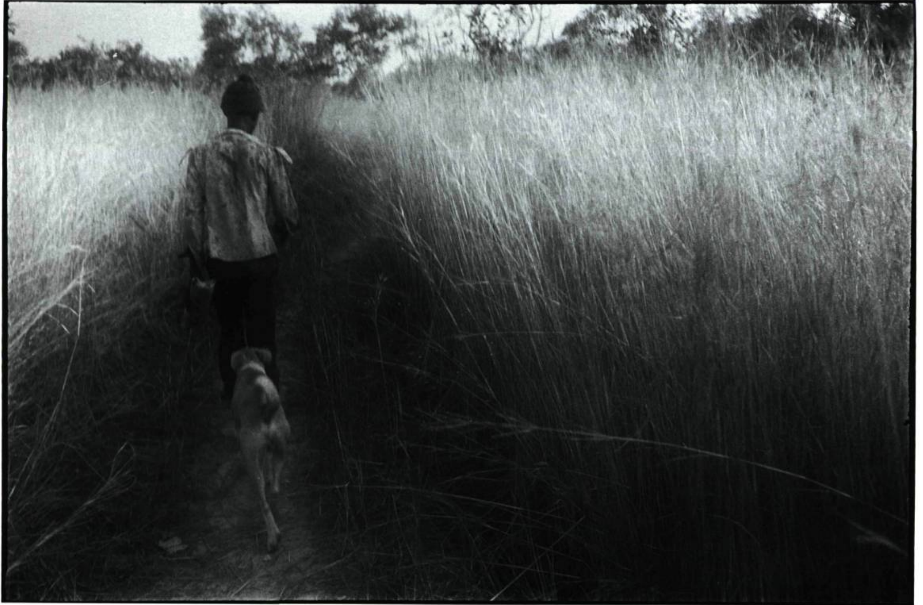
ALAIN CHAGNON Sénégal