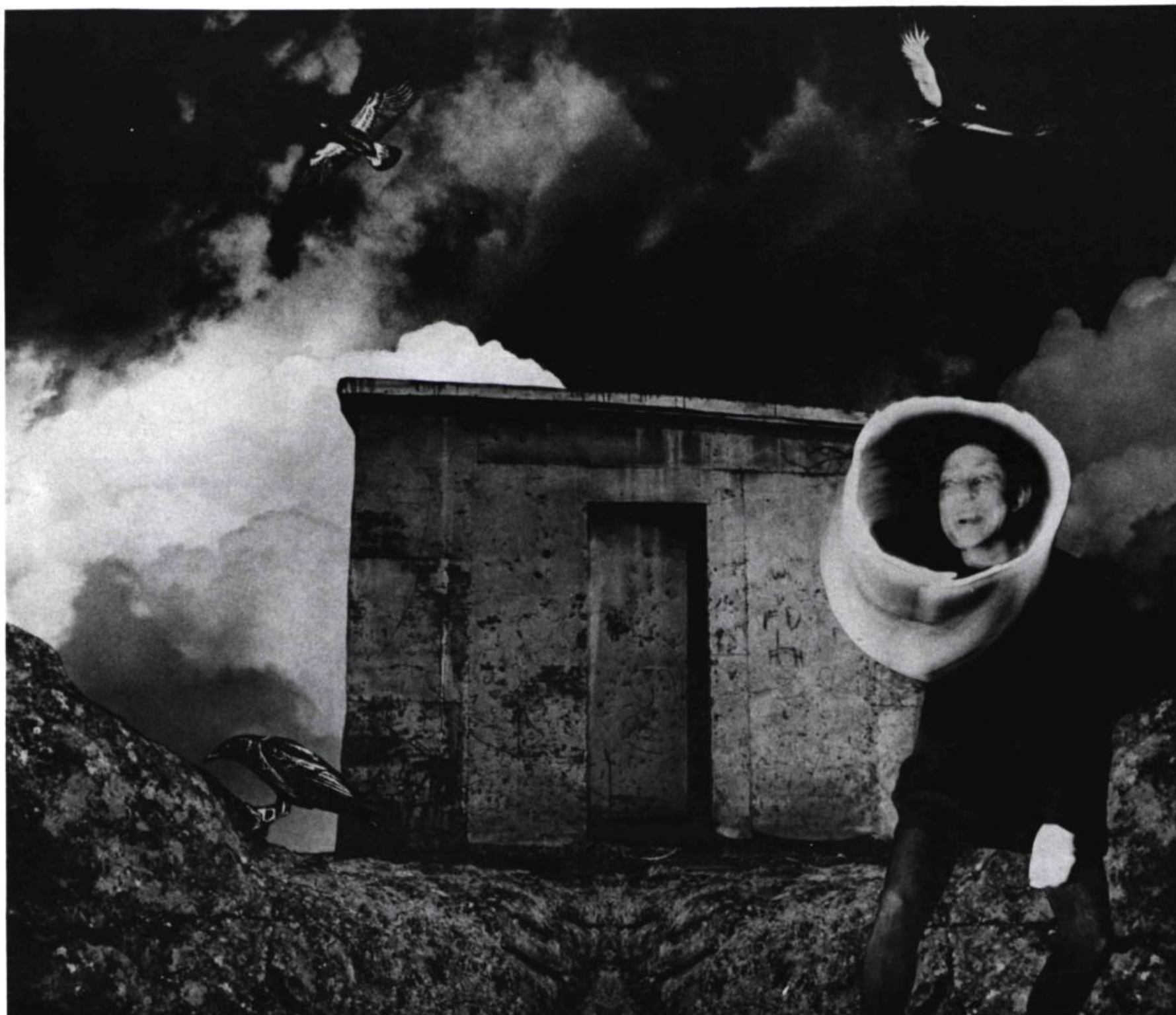
Petit diablotin pris sur le vif exécutant une danse de pouvoir année et lieu inconnu.