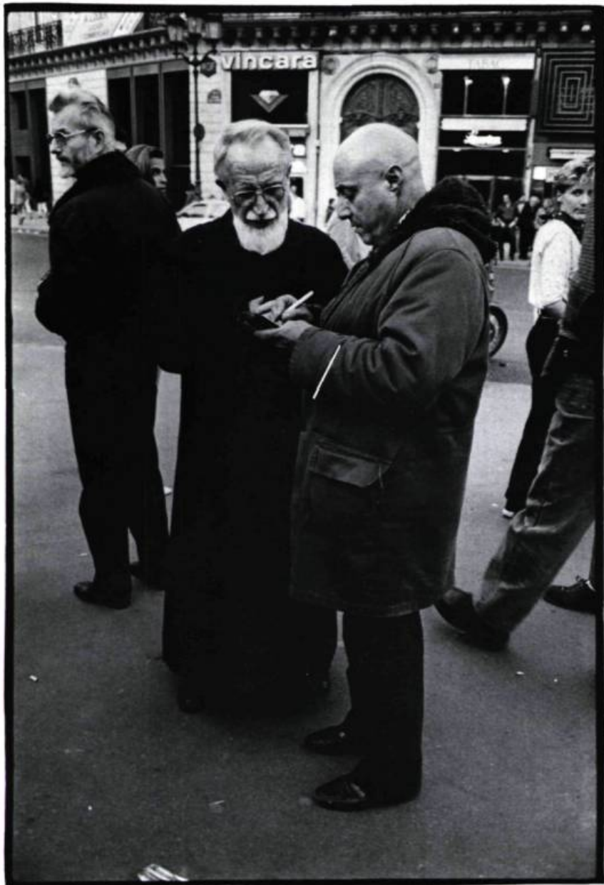
SYMPATHISANTS M. LE PEN, PARIS, OCT. 86 / MANIFESTATION

à quoi bon se torturer, la vie est belle dans le fond. garçon! je paie une tournée: la dolce vita per tutti et allons voir ce qui se passe ailleurs.