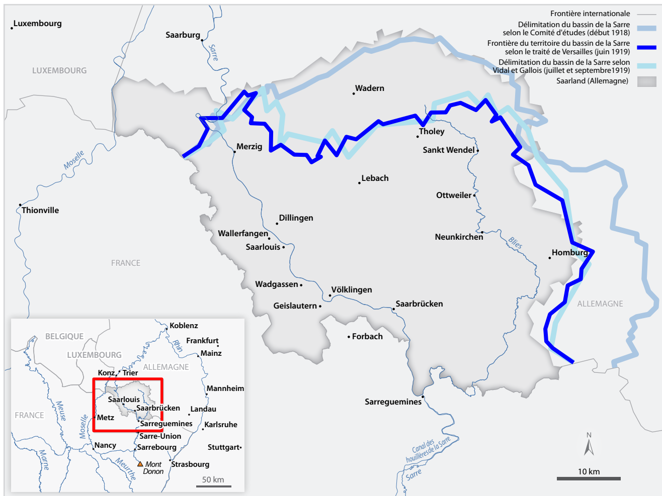
FIGURE 1 Le territoire du bassin de la Sarre selon le Comité d'études (1918) et selon le traité de Versailles (1919) | Réalisation : Mercier et Tremblay-Breault