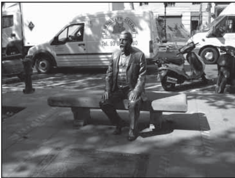
Figure 4a Sculpture de l'architecte Rovira face à l'Ensanche

Il est intéressant de constater l'importance, au cœur des espaces publics, de l'œuvre d'art, symbole de mémoire mais aussi de contemporanéité. Ces deux dimensions véhiculées par l'art retiennent l'attention des urbanistes et architectes du moment. Ces derniers ont fait de Barcelone une ville qui valorise l'ouverture sur le monde, au moyen d'œuvres d'art réalisées par des artistes étrangers. La figure 4 souligne l'importance de ces deux esprits qui appartiennent au quotidien des Barcelonais. De plus, ils confèrent un potentiel touristique considérable à Barcelone. Toutefois, ces orientations ont suscité de nombreuses critiques concernant le caractère