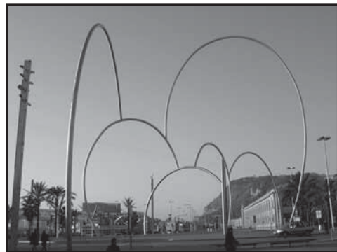
Figure 4b Sculpture contemporaine au cœur de l'espace public