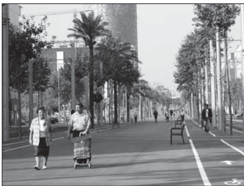
Figure 7 La Diagonal : un nouvel espace de déambulation, septembre 2004

Afin que la voie publique serve de lien entre pratiques traditionnelles et activités contemporaines, l'urgence de requalifier certains quartiers a parfois abouti à la réalisation de formes particulières de ramblas , comme celle de Prim. Faisant 60 m de large et 2,5 km de long, elle est devenue une sorte de parc linéaire au cœur d'un quartier d'habitation typiquement moderne, avec ses grands blocs isolés. De façon générale, le type de voie retenu semble dépendre en partie des caractéristiques morphologiques et socioculturelles du quartier. Nous avons remarqué que ce sont des considérations