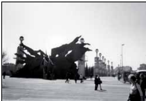
Figure 5 Quand l'art crée la surprise (entrée du Parc de l'Espanya industrial)