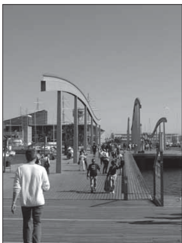
Figure 8 La Rambla del mar : un prolongement vers la mer, décembre 2004

De nos jours, la rambla est un élément important de l'espace urbain barcelonais, et elle est présente dans plusieurs aménagements récents. Cela se traduit de différentes manières, depuis la construction de la rambla jusqu'à la seule utilisation du nom qui est un symbole de la ville.