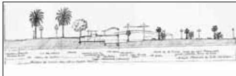
Figure 9b Profil du Passeig de Colon - Moll de la Fusta

Dans la continuité des aménagements réalisés en bordure de mer, sur le Passeig Marítim de la Barceloneta, on peut apercevoir un espace de promenade où l'agencement du mobilier urbain invite à la contemplation du panorama (figure 10). Les sièges sont disposés de telle façon que les personnes peuvent s'isoler ou bien rechercher le contact avec les autres. Cet espace est aménagé en fonction de la mise en scène du panorama de moments de repos ou de distraction, de réflexions, voire de rencontres. L'expérience du déplacement s'enrichit d'une dimension d'ouverture sur l'environnement parcouru.