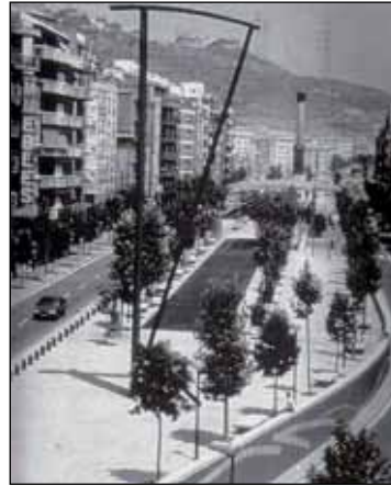
Figure 6 La Via Júlia

Source : Jordi Borja, Zaida Muxi. Op.Cit. , 2003, p.151