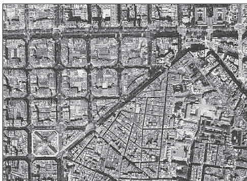
Figure 2 Vue aérienne de l'Ensanche

L'espace, qui occupait une place centrale dans la réflexion de Cerdà, devait être aménagé en vue de créer une ville homogène, capable d'assurer l'équivalence de toutes les situations spatiales (Cerdà, 1979 : 25). De plus, la proposition du plan en damier s'est imposée pour garantir l'hygiène publique et l'indépendance du foyer, tout en facilitant les relations sociales par la mise en place d'un système de communication efficace (figure 2).