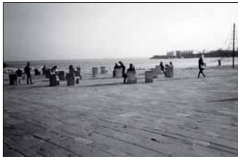
Figure 10 Vue sur la mer, mars 2003 (Passeig Marítim de la Barceloneta)

À travers l'exemple du Passeig Marítim, on peut voir «la formalisation des relations entre des éléments apparemment aussi antithétiques du point de vue des usages qu'une autoroute de ceinture, une grille de voirie urbaine et toute une gamme d'espaces de promenade est résolue de façon audacieuse» (Sokoloff, 1999 : 67). Cette complexité est visible à travers le profil du Passeig de Colon (figure 9b).