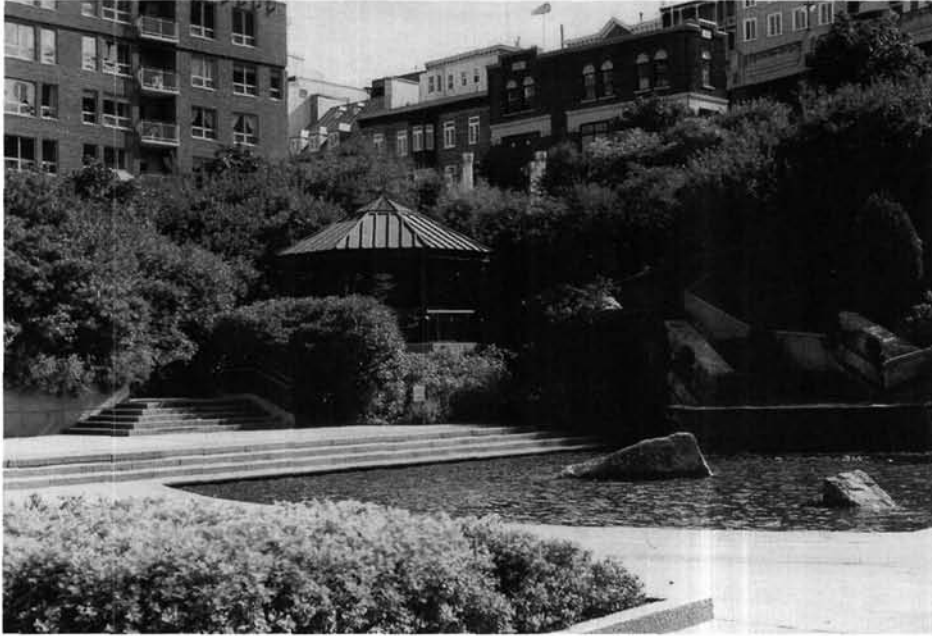
Photo 2 Le jardin Saint-Roch

Le complexe Méduse est un troisième exemple de projet de développement lié à la revitalisation de Saint-Roch. Il s'agit d'un complexe axé sur les arts qui regroupe des coopératives de production, des ateliers d'artistes, des salles de spectacles et de conférences, de même qu'un poste de radio communautaire et un restaurant (photo 3). Cet équipement est le résultat d'un partenariat entre plusieurs organismes. Il a été réalisé en 1995 grâce à la participation financière de la Ville de Québec, du Ministère des Affaires culturelles du Québec, du gouvernement fédéral et de la caisse d'économie des travailleurs du Québec. Méduse s'insère dans une stratégie de développement du quartier selon la thématique des arts et de la culture. Situé sur la côte d'Abraham, Méduse tente de créer un lien entre le quartier Saint-Roch et le quartier Saint-Jean-Baptiste, ce dernier étant situé en haute-ville. Ce complexe constitue également un effort significatif de restauration et d'intégration architecturale de bâtiments dans un tissu urbain ancien.