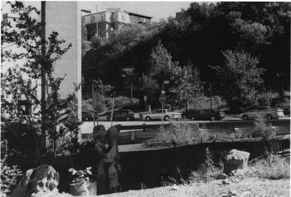
Photo 1 L'îlot Fleury sous l'autoroute en viaduc