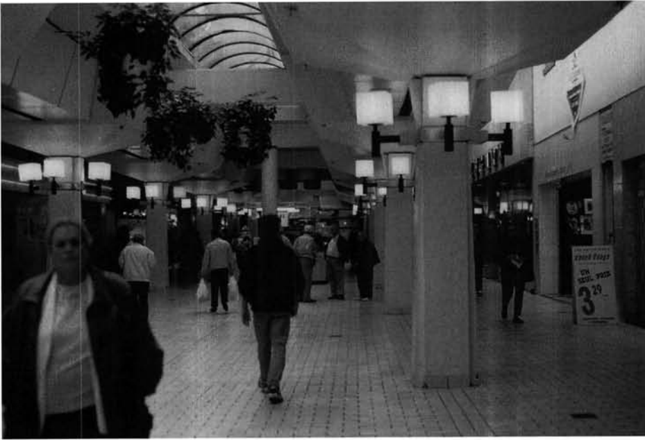
Photo 4 Le Mail Centre-ville