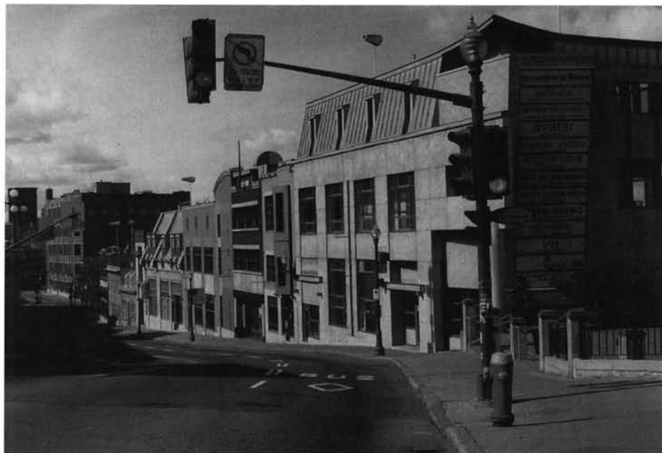
Photo 3 Le complexe Méduse

réalisée sans la participation des citoyens, bien qu'il y ait eu un référendum auprès des commerçants, semble aujourd'hui appréciée par une large proportion des résidents (photo 4). En effet, les consultations publiques menées par la Ville de Québec au printemps 1998 sur le programme « rebâtir la rue Saint-Joseph » ont montré l'attachement des citoyens à cet équipement qui assure une fonction sociale importante en accueillant des populations marginalisées (Ville de Québec, 1998). En dépit de cela, la reconversion en artère commerciale traditionnelle d'une partie de la section de la rue Saint-Joseph est actuellement en cours.