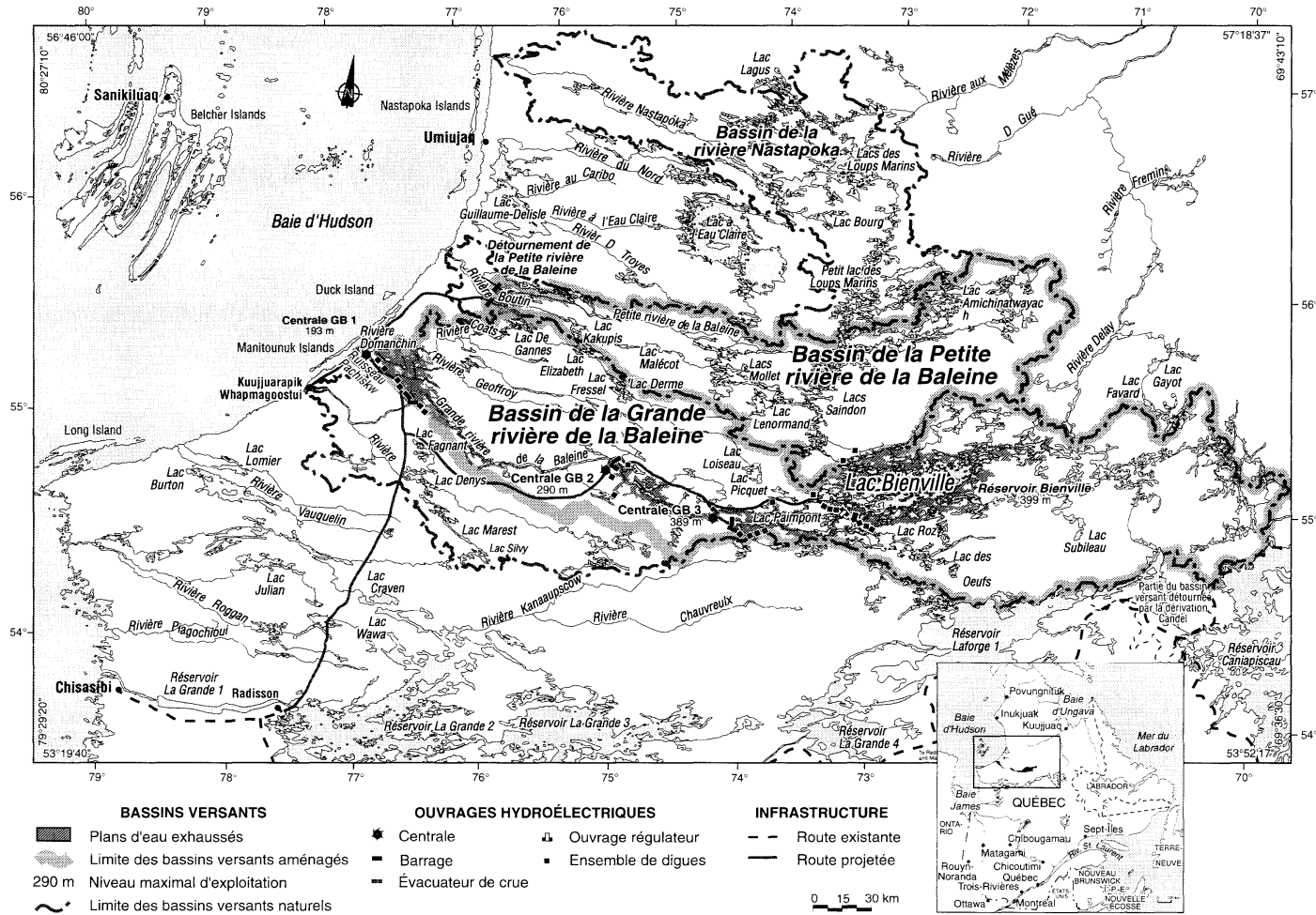
Figure 1 Le projet Grande-Baleine tel que présenté par Hydro-Québec en 1993