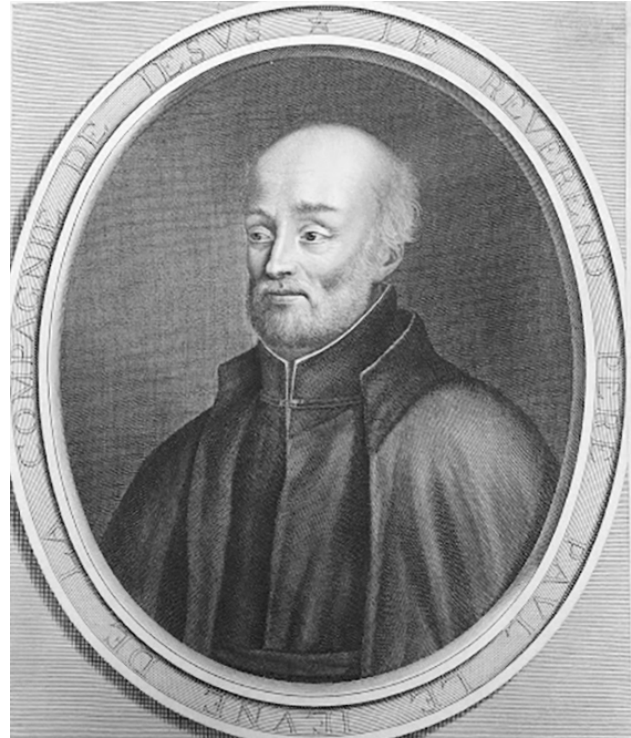
Paul Le Jeune