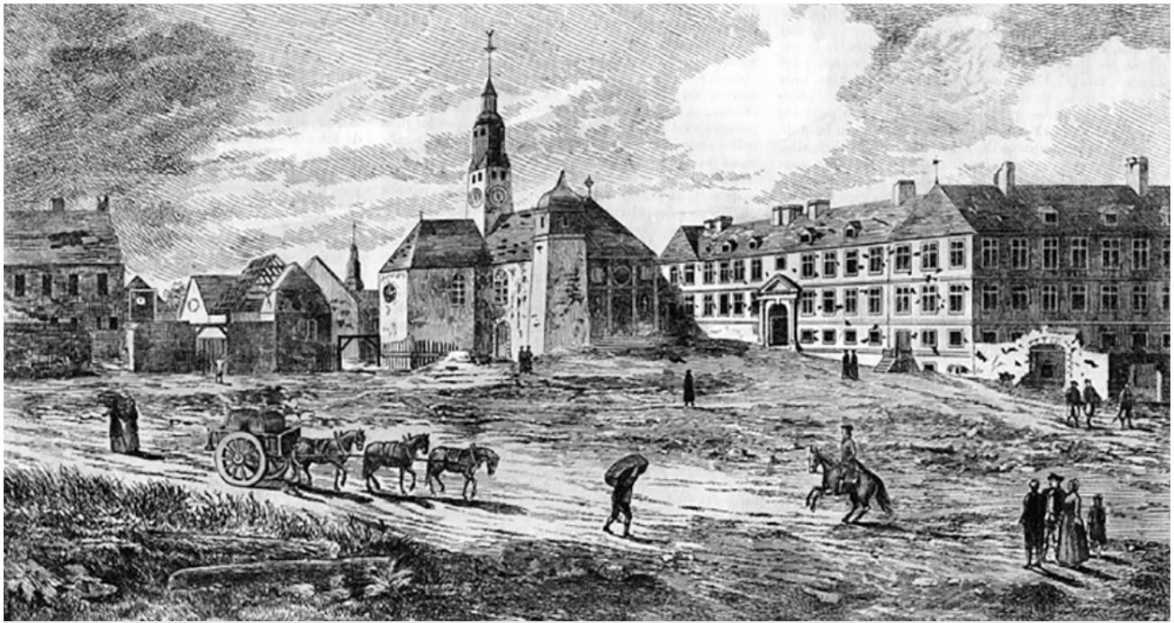
Collège des Jésuites de Québec

Le Collège de Québec a connu de nombreux agrandissements aux XVII e et XVIII e siècles afin de répondre aux besoins éducatifs grandissants en Nouvelle-France. Avec la Conquête en 1759, les bâtiments seront convertis en casernes et logements pour les officiers britanniques. ( Le collège et l'église des Jésuites à la Conquête . Gravure de Richard Short, 1761, N016369).