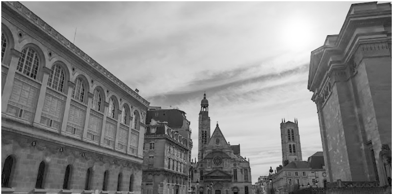
Bibliothèque Sainte-Geneviève à Paris

La bibliothèque Sainte-Geneviève était à l'origine celle d'une abbaye. De passage à Paris, Louis Nicolas a fréquenté ce lieu pour bénéficier d'un accès à de très nombreux livres.