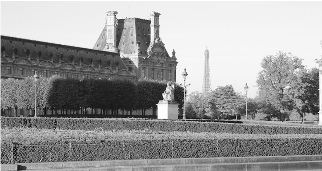
Jardins des Tuileries, Paris.

Dans son Histoire naturelle , Louis Nicolas parle des cèdres du jardin des Tuileries à Paris. Cet ensemble, bâti au XVI e siècle sur une ancienne tuilerie, longe le palais du Louvre, qu'on aperçoit ici.