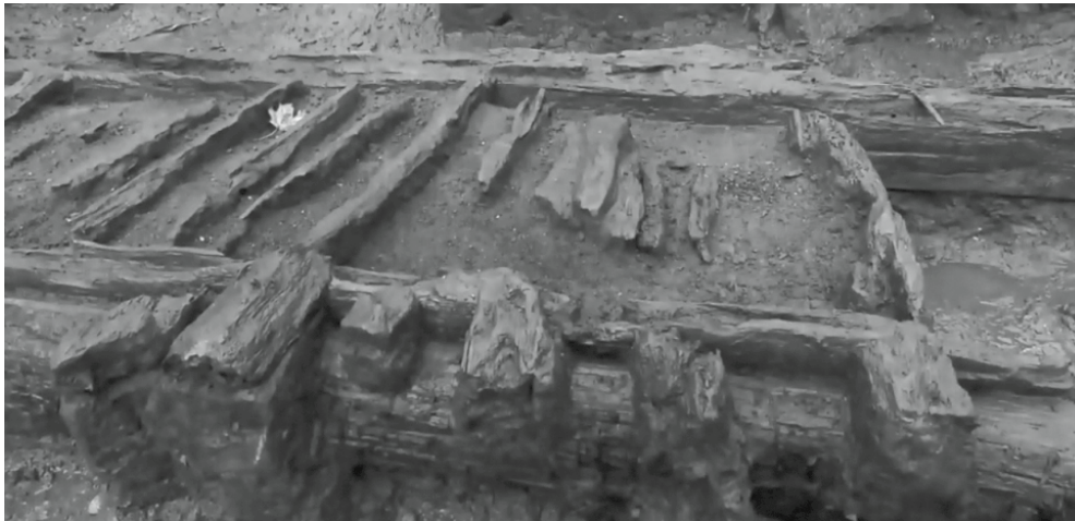
Section de la palissade découverte.

plateforme accueillant les pieux, ainsi qu'une section de la banquette du parapet. Il s'agirait d'une portion de l'ancien bastion Saint-Louis.