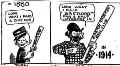
THEN AND NOW

Interest in National Pastime Crowds Out Early Fondness for Lacrosse of Man Recently Elected President of Boston Red Sox.