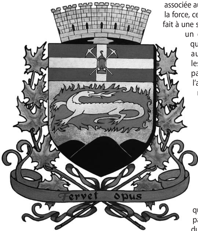
Armoiries de Thetford Mines.

associée aux animaux est celle de la force, ce qui correspond tout à fait à une société où l'on retrouve un gouvernement rigide qui prône le respect des autorités traditionnelles. Les mineurs qui ont participé à la grève de l'amiante, en 1949, pourraient le confirmer. De même, les animaux choisis témoignent des multiples mouvements qui touchent au monde municipal au Québec pendant la première moitié du XX e siècle. En effet, durant cette période, de nombreuses municipalités sont créées, ce qui explique sûrement en partie la forte présence du lion dans les armoiries produites par l'organisme montréalais.