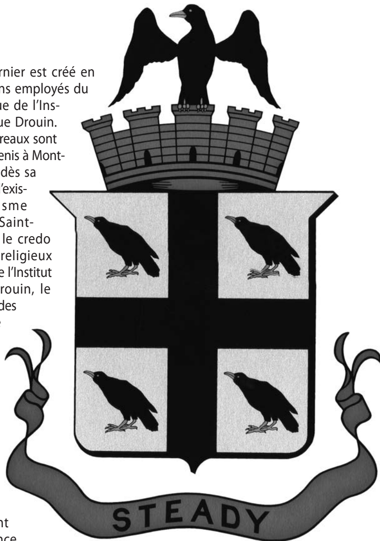
Armoiries d'Aylmer.

armoiries. Ce dernier est créé en 1954 par d'anciens employés du service héraldique de l'Institut généalogique Drouin. À l'origine, ses bureaux sont situés rue Saint-Denis à Montréal. Cependant, dès sa troisième année d'existence, l'organisme déménage rue Saint-Hubert. Comme le credo de l'héraldique religieux est la mainmise de l'Institut généalogique Drouin, le Collège canadien des armoiries décide de faire du secteur municipal sa spécialité en signant une entente avec l'Union des municipalités de la province de Québec, en 1955. Celle-ci porte fruits puisque pendant sa courte existence (l'organisme disparaît en 1960), le Collège canadien des armoiries réalise près de 200 armoiries de municipalités du Québec. De ce nombre, 32 % (60 sur 189) contiennent un ou des animaux. Loin d'être un concept nouveau, l'utilisation d'animaux comme symboles remonte aux prémices de la science héraldique. De fait, ceux-ci, comme dans un rébus, symbolisent les noms des villes. Par exemple, les armoiries de la ville de Saint-Ours contiennent