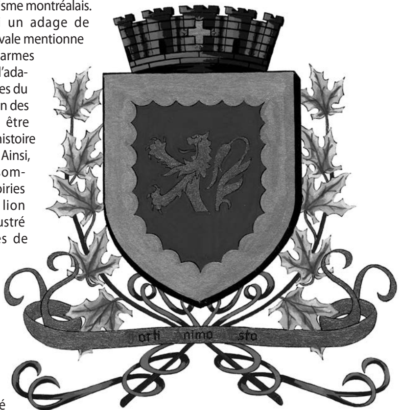
Armoiries de Naudville. (Société d'histoire du Lac-St-Jean).

Michel Pastoureau, « Ours, lion, aigle : enquête sur le roi des animaux », L'Histoire , n° 114 (septembre 1988), p. 16-24.