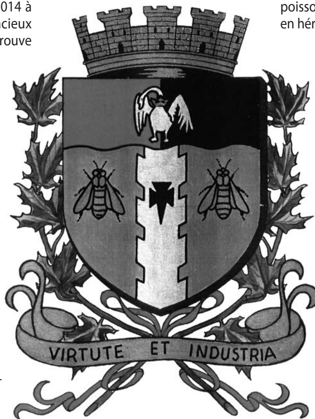
Armoiries de Buckingham.

À côté de tous ces animaux apparaît un groupe de créatures issu de la mythologie et de l'imaginaire. Ainsi, les armoiries de Papineauville contiennent un cheval ailé qui symbolise l'éloquence de Louis-Joseph Papineau. De son côté, le dragon sur les armes de Saint-Georges-de-Champlain rappelle le combat que livra saint Georges au légendaire dragon. Figure aussi honorable en art héraldique que le lion ou l'aigle, le griffon, qui est une fusion des deux animaux, représente sur le blason de Terrebonne les « premiers pionniers de la population française de la municipalité, l'attachement de celle-ci à tout ce qui touche son patrimoine et l'obligation