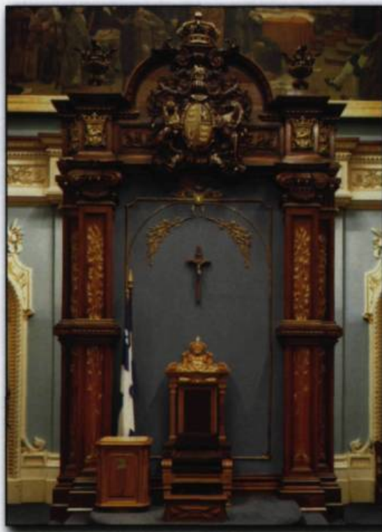
La devise « Dieu et mon droit » au-dessus du trône.

En Grande-Bretagne, considérée comme la Mère des parlements, les élus siègent toujours dans un ancien monastère –