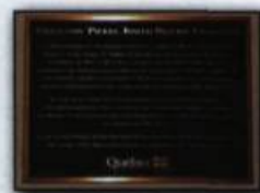
Plaque de la collection Pierre-Joseph-Olivier-Chauveau, conservée à la bibliothèque de l'Assemblée nationale. Photographie de Sylvain Lizotte, 2006. Répertoire du patrimoine culturel du Québec . (Ministère de la Culture, des Communications et de la Condition féminine).

Jean-François Drapeau Direction du patrimoine et de la muséologie, Ministère de la Culture, des Communications et de la Condition féminine