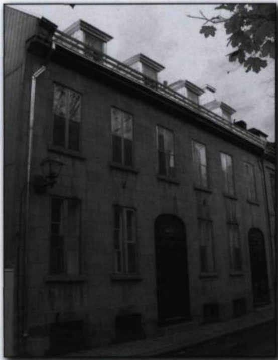
Maison du Vieux-Québec habitée par Joseph-Alfred Mousseau. Photographie de Pascale Llobat, 2006. Répertoire du patrimoine culturel du Québec . (Ministère de la Culture, des Communications et de la Condition féminine).

immeubles. Des travaux sont en cours pour documenter les quelque 55 000 biens mobiliers protégés par le gouvernement du Québec.