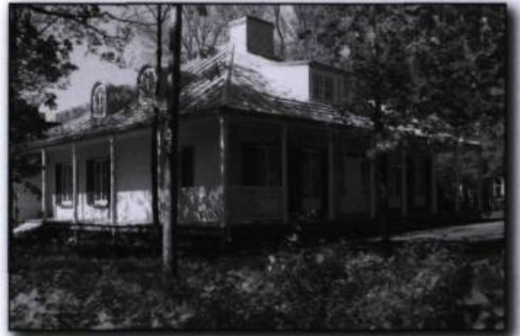
Maison Henry-Stuart, classée monument historique. Photographie de Marie-Claude Côté, 2003. Répertoire du patrimoine culturel du Québec . (Ministère de la Culture, des Communications et de la Condition féminine).

Le Répertoire du patrimoine culturel du Québec est l'interface grand public, disponible sur Internet, du système de gestion et de diffusion du