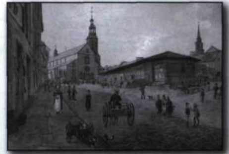
James Pattison Cockburn. La rue de la Fabrique et la cathédrale Notre-Dame de Québec , aquarelle et graphite sur papier, vers 1829.

D'autres créateurs pratiqueront un art dans lequel on peut voir aujourd'hui une chronique de la vie quotidienne et un témoignage sur le développement urbain de la cité. C'est le cas des aquarelles, empreintes de calme et d'harmonie coloniale, du peintre topographe anglais James Pattison Cockburn qui propose diverses vues de la capitale entre 1829 et 1831, des tableaux apocalyptiques que Joseph Légaré consacre aux grandes tragédies – choléra, éboulis, incendies – qui ont bouleversé Québec pendant la première moitié du XIX e siècle, des représentations visuelles réalisées à la fin du XIX e siècle par Jules-Ernest Livernois qui utilise alors une nouvelle technique, la photographie, dont on ne sait pas encore si elle est un art.