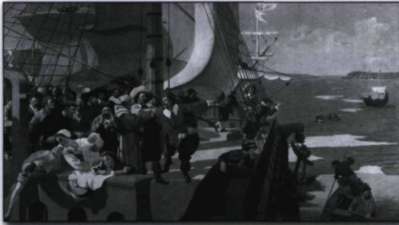
■ L'arrivée de Champlain à Québec, tel qu'imaginée par Henri Beau en 1903. Commandée à l'artiste pour orner la salle du Conseil législatif, cette œuvre suggère que Champlain s'est rendu à Québec à bord du Don-de-Dieu . C'est plutôt en barque que l'explorateur arrive à Québec en 1608, ayant effectué le trajet ainsi depuis Tadoussac. (Musée national des beaux-arts du Québec, 34-04).

région de Québec et, selon l'arboriculteur Jean Lamontagne, Tequenonday constitue l'exemple parfait du type de forêt qui recouvrait le sommet du promontoire de la colline de Québec il y a de 150 à 200 ans.