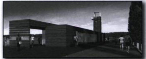
Illustration du pavillon d'accueil du quai des Cageux, à l'extrémité ouest de la promenade Samuel-De Champlain, dont les lignes rappellent des empilages de bois. Conception et design : Le consortium Daoust Lestage inc. Williams, Asselin, Ackaoui, Option Aménagement ©. (Commission de la capitale nationale du Québec).

Le long du Saint-Laurent, les madriers s'étendent à perte de vue de la fin avril jusqu'au gel. En hiver, plusieurs ouvriers travaillent comme bûcheron en Outaouais, coupant le bois avec lequel ils reviendront au printemps : ces ouvriers qui dirigent les radeaux sont appelés cageux ou raftmen . Majoritairement Canadiens français, ils