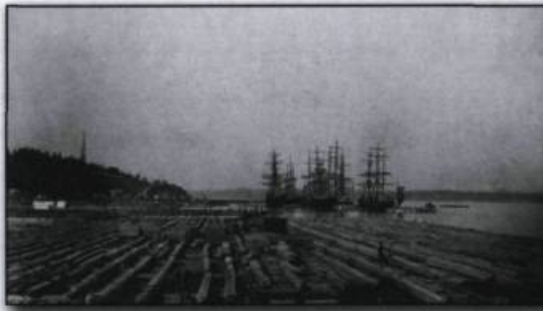
Les anses à bois de Sharple et Dobell à Sillery, en 1891.

La station des Cageux forme donc la nouvelle promenade Samuel-De Champlain, avec la station des Quais à l'est, la station des Sports et le boisé de Tequenonday, et contribue à rendre un hommage mérité au Saint-Laurent, principal acteur