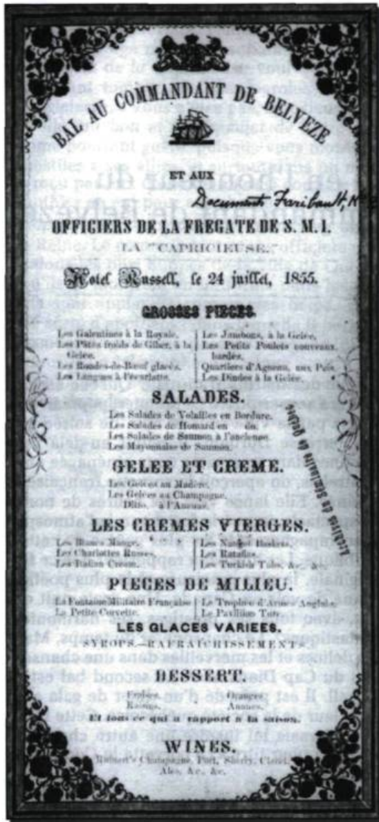
Menu du bal au commandant de Belvèze et aux officiers de la frégate de SMI La Capricieuse à l'hôtel Russel, Québec, le 24 juillet 1855. (Archives du Séminaire de Québec).

Sans doute, mais les paroles des élites ont un accent de sincérité que l'humble ouvrier des quartiers populaires ressent lui aussi dans sa mansarde de bois rond, où il n'y a point de napperon brodé sur la table ni de lingerie fine dans les armoires façonnées par les artisans des campagnes, mais où les cœurs battent aux mêmes évocations que ceux des lettrés, des clercs et des politiciens.