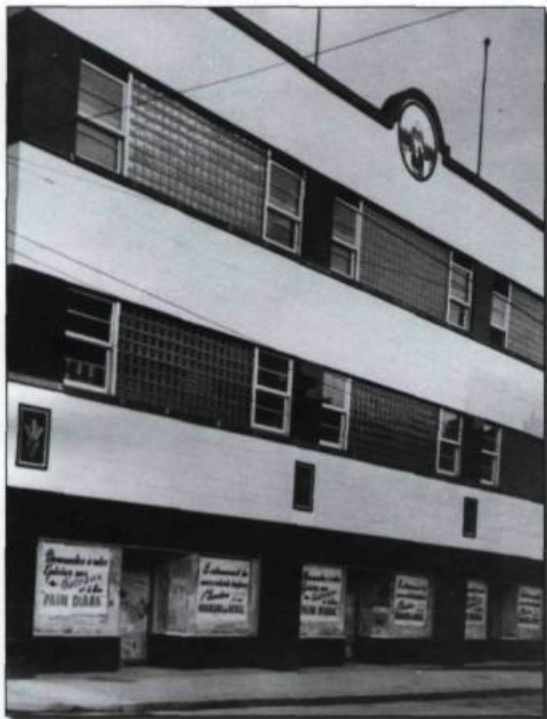
La boulangerie Jos. Vaillancourt, rue Saint-Joseph, vers 1945, première «boulangerie industrielle» de Québec.

Les porteurs de pains deviennent des livreurs de pains. La boulangerie Jos. Vaillancourt est la première, au tournant des années 1950, à remplacer toutes ses voitures de livraison à traction hippomobile par des camionnettes. Les camionnettes rouge bourgogne de Hethrington sillonnent les rues. Mais jusqu'à la fin des années 1950, du pain est encore livré à l'aide de chevaux. En 1952, la boulangerie Pain Simard ltée fait sa livraison dans les quartiers de la basse-ville avec sept voitures à chevaux. Cinq camionnettes desservent la haute-ville et des secteurs trop éloignés de la boulangerie. Elle possède aussi douze camions pour la livraison aux commerces. À compter de la fin des années 1940, les livreurs de Pain Simard ltée portent un uniforme bleu aviateur. En 1952, un livreur reçoit 25 dollars par semaine, auxquels s'ajoutent 14 % de l'argent et des bons perçus des clients. Comme les laitiers, les boulangers ont mis au point un système de bons, permettant aux clients de n'avoir à déboursier qu'à l'occasion.