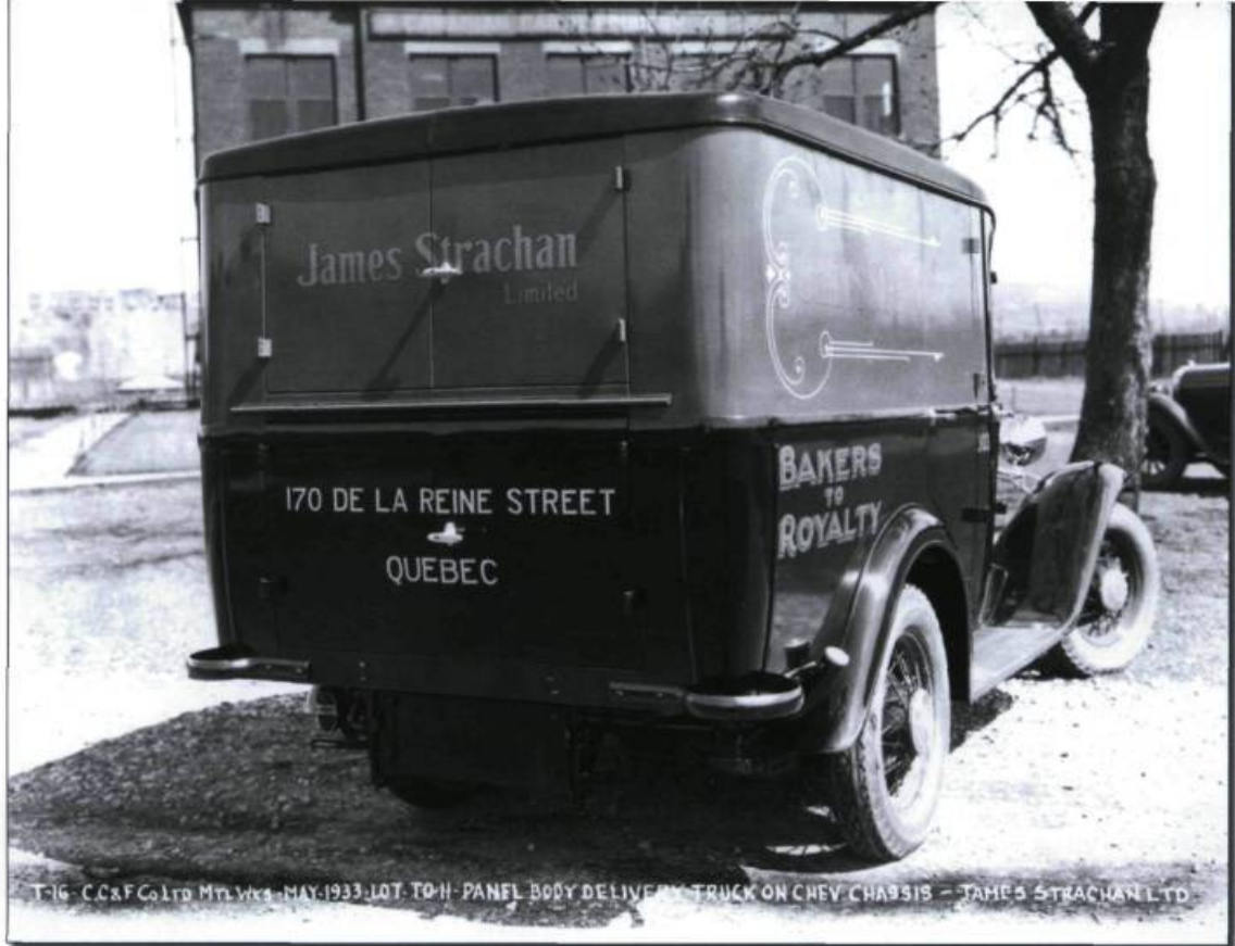
Camion de livraison (1933) de James Strachan Limited, 170, rue de la Reine, Québec. (Collection Yves Beaugard).