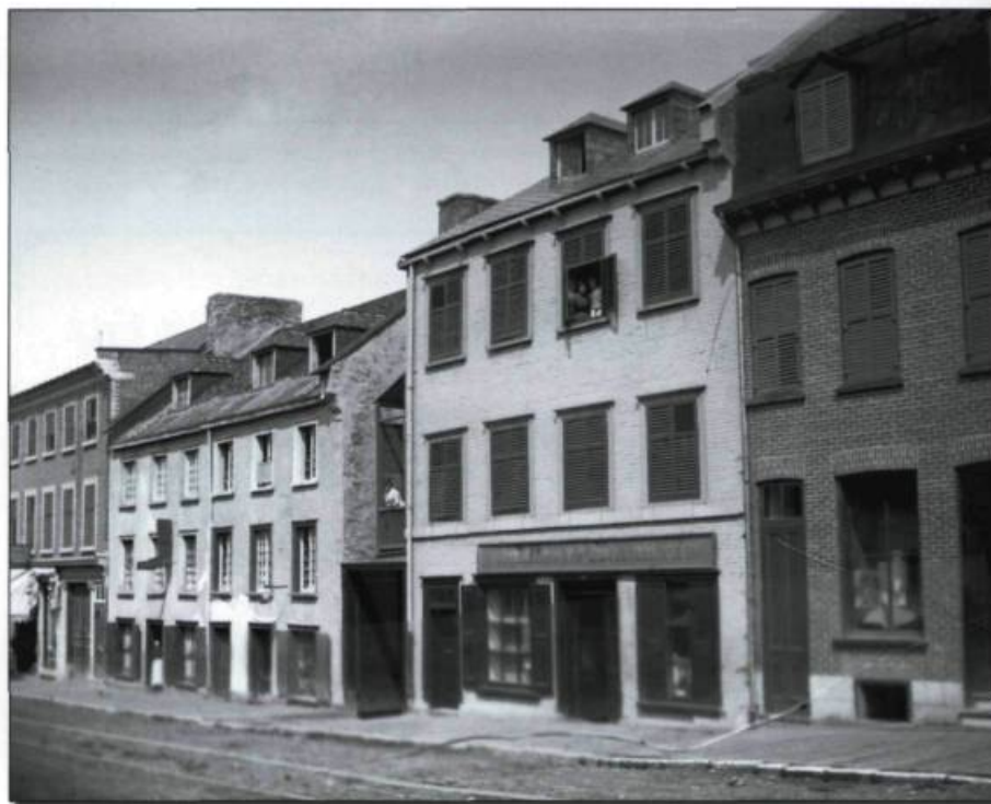
■ La boulangerie Hethrington, dans le faubourg Saint-Jean, photographiée par un membre de la famille, à la fin du XIX e siècle. (Archives nationales du Québec).

le marché du pain. Mais une nouvelle entreprise aux techniques de vente dynamiques ouvre ses portes, en 1929, la boulangerie Nationale de la rue Saint-Ignace. Un incendie la détruira, en 1939, et elle s'installera plus tard dans le quartier Limoilou.