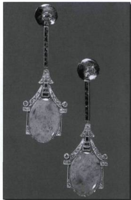
Pendants d'oreilles, influence chinoise, jade, émeraudes et diamants sur platine, vers 1925.

Dans les années 1930, on s'entiche de l'alliance platine-diamants pour son «look tout blanc». On aime également les bijoux massifs, audacieux et géométriques sans ajouts décoratifs.