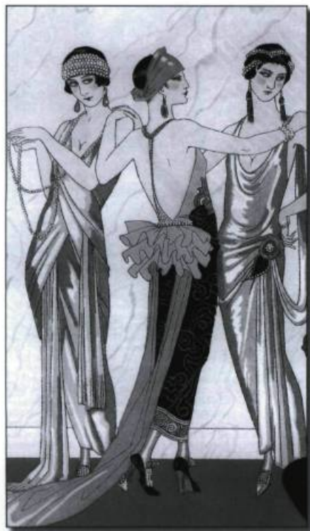
Georges Barbier : illustration pour Falbalas et Fanfreluches parue dans l' Almanach des Modes , 1924. (Archives de l'auteure).

L'innovation la plus importante dans le domaine du bijou a été le clip, aussi appelé «broche à pinces» ou «duette». Par paire, les clips ornent chaque côté d'une robe ou le dessus des souliers. Le clip est porté seul sur un chapeau, le revers d'une veste, ou appliqué sur un sac ou même un bracelet. Assemblées par une