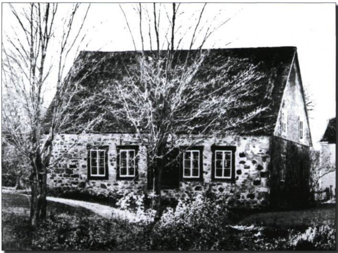
École de l'Institution royale du village des Aulnaies. ( Revue Desjardins , octobre 1963). (Archives de Cap-aux-Diamants).

La féminisation de l'enseignement primaire tient aussi à l'affirmation de l'Église catholique. La venue de l'État dans l'éducation, concrétisée par les lois de l'Institution royale et de syndics, l'engagement de la bourgeoisie à travers les sociétés d'éducation ainsi que l'existence de nombreuses écoles indépendantes dans les villes de Montréal et de Québec, avaient considérablement réduit l'importance de l'Église dans l'enseignement primaire durant les premières décennies du XIX e siècle. Il se produisit même une diminution de l'importance relative des enseignants religieux, à la faveur de l'établissement des écoles de syn-