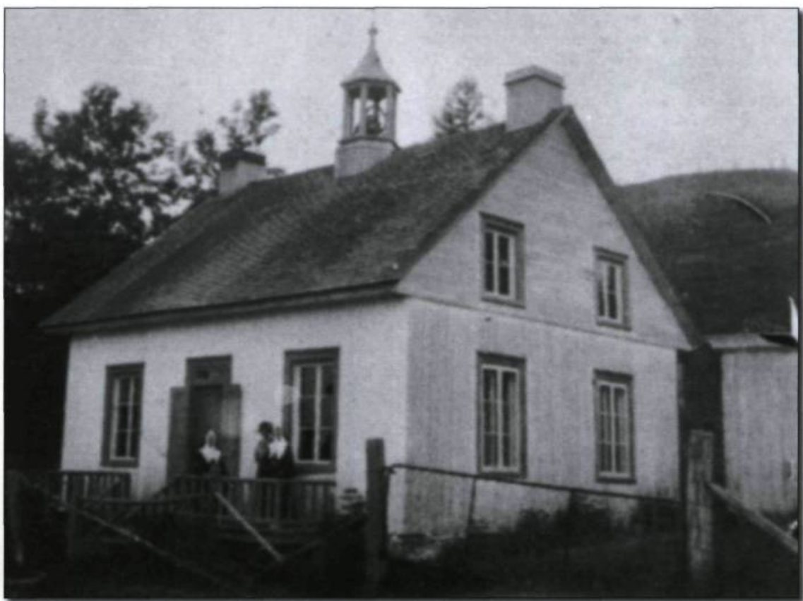
Petite école du Bas-de-Sainte-Anne (Sainte-Anne-de-la-Pérade), vers 1905. (Vénérande Douville-Veillet. Souvenirs d'une institutrice de petite école de rang . Trois-Rivières, Les Éditions du Bien Public, 1973).

Ces privilèges ne changeaient pas vraiment la nature du réseau scolaire. Ce qui permit véritablement à l'Église catholique de dominer le réseau scolaire catholique, dans le dernier tiers du XIX e siècle, ce fut un changement d'attitude de la population en général. Le milieu de ce siècle fut le témoin d'un «réveil» religieux, pas seulement dans la vallée du Saint-Laurent, mais aussi dans l'Amérique de langue anglaise et en Europe. Ici, de grandes prédications étaient menées par de véritables vedettes. Le meilleur exemple en est l'abbé Charles Chiniquy. Il fut au centre d'une grande campagne qui amena une proportion considérable de Canadiens à joindre une société de tempérance. M re Ignace Bourget, à Montréal, multipliait les créations de congrégations religieuses féminines, alors qu'on amenait de France les communautés d'hommes. Elles étaient nombreuses à œuvrer en éducation. Signalons seulement parmi les dernières les Frères des écoles chrétiennes et les jésuites, chassés de Nouvelle-France au moment de la Conquête.