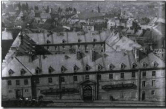
Collège des jésuites à Québec.