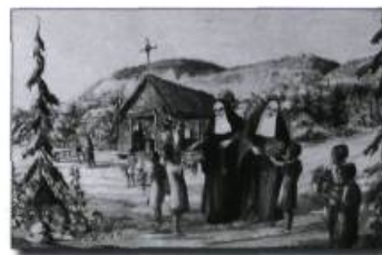
Arrivées à Québec, en 1639, les ursulines de Marie de l'Incarnation se consacrent à l'éducation des petites Amérindiennes et des Françaises. Illustration contemporaine.