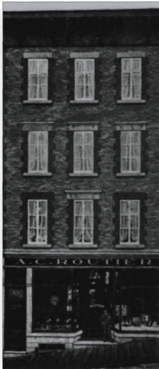
Le bel édifice qu'Alfred-Charles Routier fit ériger dans la côte de la Montagne en 1902. « Il y a 100 ans », Québec, 1934. (Archives de l'auteur).

mes étaient ornées de cœurs, de fleurs et d'oiseaux.