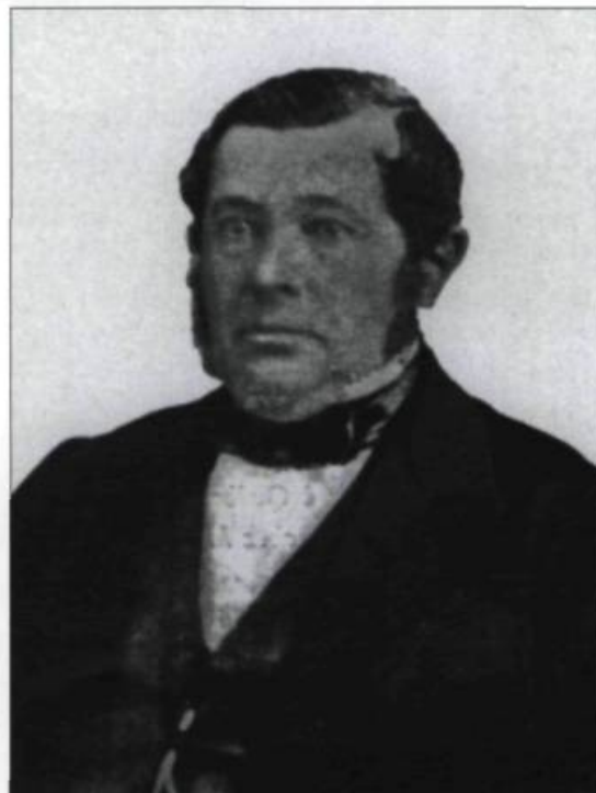
Charles Routier fonde sa boutique d'horlogerie en 1834. «Il y a 100 ans», Québec, 1934.

Charles Routier était originaire de Sainte-Foy, une paisible paroisse agricole près de Québec. Il avait