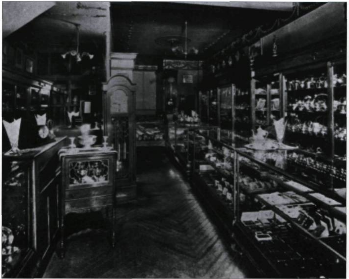
Une vue de l'intérieur de la boutique Routier, en 1934. «Il y a 100 ans», Québec, 1934.

montres de poche cédèrent peu à peu la place aux montres-bracelets.