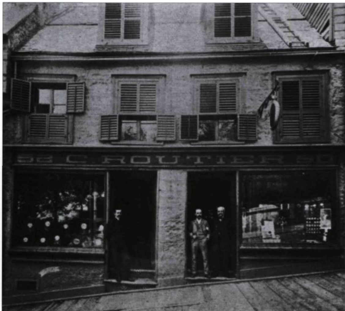
Dans la côte de la Montagne, la boutique des Routier, de 1849 à 1894. «Il y a 100 ans», Québec, 1934.