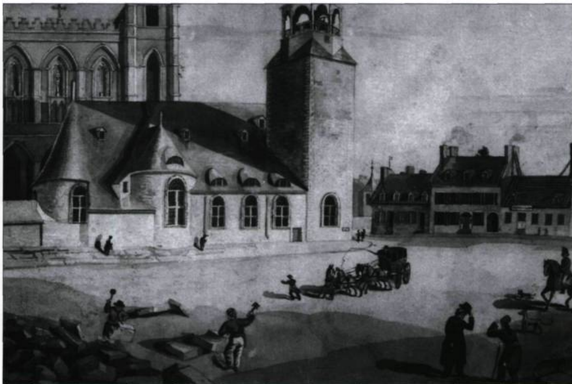
La première église Notre-Dame de Montréal fut terminée en 1683. On l'aperçoit ici au moment où s'achève la construction de la nouvelle église. Gravure de Robert Auchmaty Sproule, 1830. (Archives de Saint-Sulpice, Montréal).

Les sulpiciens voulaient être missionnaires auprès des autochtones. Durant la première décennie, ils