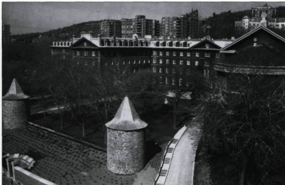
Le Grand séminaire de Montréal de 1857 est toujours dirigé par les sulpiciens. Photographie : Claude Turmel, 1990. (Archives de Saint-Sulpice, Montréal).

Cependant, par la force des circonstances, un souci est devenu majeur : la formation des prêtres. Dès 1840, M re Bourget demandait aux sulpiciens de fonder le Grand Séminaire de Montréal. Plus de 6 000 prêtres y ont été formés à ce jour. En 1888, ce fut le début du Collège canadien de Rome qui accueille les prêtres étudiants. Au Canada, les sulpiciens ont dirigé aussi le Grand Séminaire de Saint-Boniface de 1954 à 1968, et sont responsables du Grand Séminaire d'Edmonton depuis 1990. De plus,