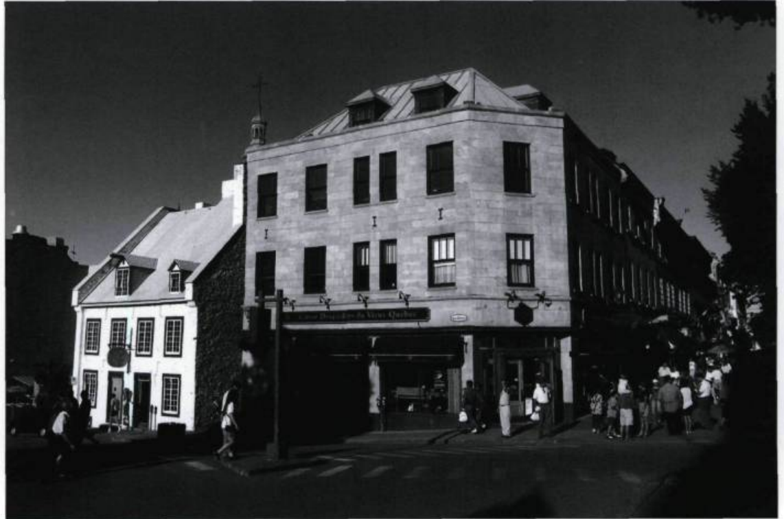
L'édifice de la Caisse populaire à l'angle de la rue des Jardins et Sainte-Anne, en plein cœur du Vieux-Québec touristique.

D.B. : Une caisse populaire, c'est d'abord et avant tout les membres qui la composent. Cela nous amène à dire, en ce qui concerne les nouvelles technologies ou les nouveaux modes de distri-