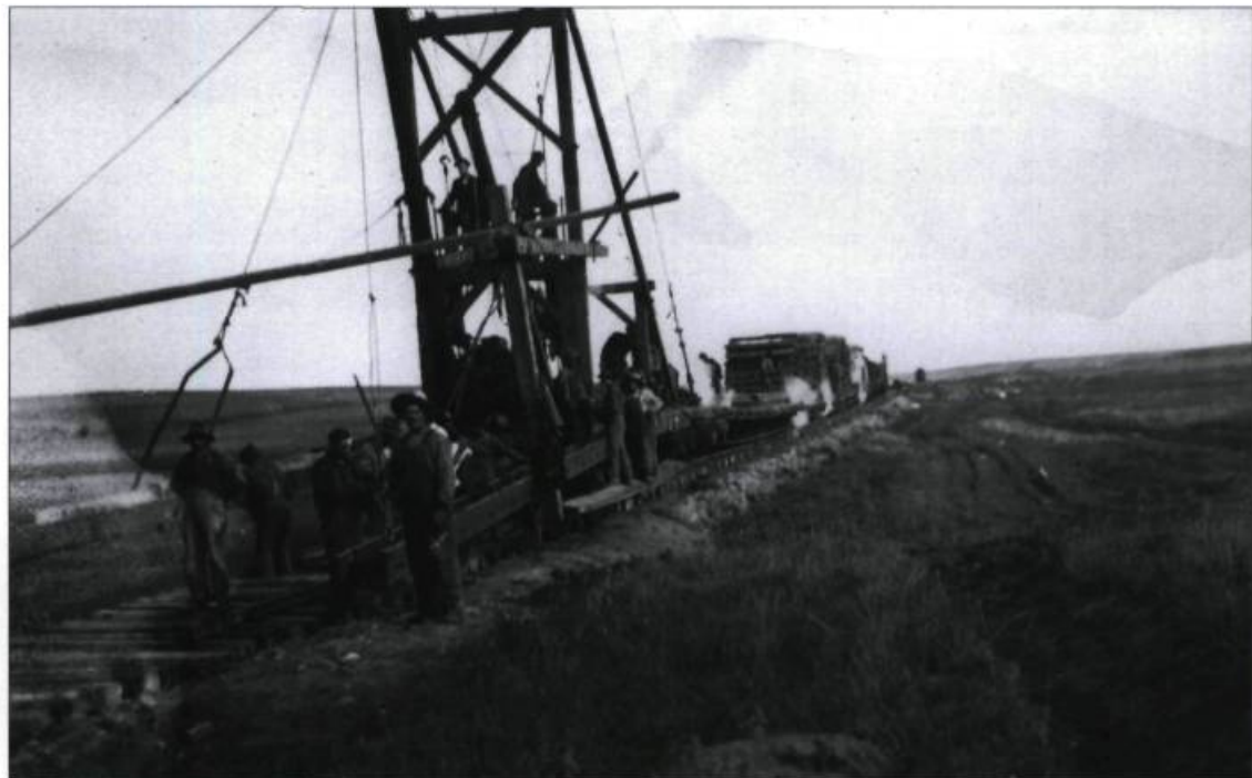
Canadiens français occupés à la pose de rails en Ontario.

Après avoir passé l'été en plein soleil à manipuler des sections d'acier, à pelleter du ballast, à