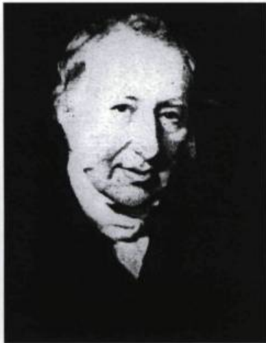
«Charles Robin, fondateur de la Charles Robin and Company».

Sa compagnie fut la plus puissante des entreprises de pêche au Canada, au point où des observateurs du XIX e siècle l'ont comparée à la Compagnie de la Baie d'Hudson.