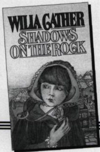
Willa Cather. Shadows on the Rock . New York : Vintage Book, 1971, 280 p.

Il existe quelques romans et nouvelles publiés en anglais qui ont la ville de Québec comme lieu d'intrigue. Ces romans ne sont plus disponibles sur le marché. Publié pour la première fois en 1931, Shadows on the Rock (paru en français en 1933 sous le titre: Les ombres sur le rocher ) raconte la vie quotidienne de Cécile Auclair, une fillette de douze ans, et de son père, Euclide Auclair, apothicaire de la petite bourgade qu'est Québec à la fin du XVII e siècle. À travers ce roman, nous faisons connaissance avec les marchands, les clercs, comme Mgr de Laval et Mgr de Saint-Vallier, les sœurs hospitalières et les braves hommes et femmes qui peuplaient les quelques habitations au pied du Cap-aux-Diamants, autour de l'église Notre-Dame-de-la-Victoire et dans la haute-ville.