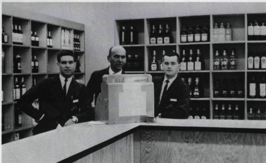
L'aménagement de cette succursale semi libre-service de la Régie des alcools du Québec permet enfin aux clients de voir les produits qu'ils désirent acheter. Photo vers 1961.

une commission d'enquête sous la présidence du juge Lucien Thinel. Suivant les recommandations de cette commission, deux entités juridiques et opérationnelles tout à fait distinctes sont créées en 1971 : la Société des alcools du Québec et la Commission de contrôle des permis d'alcool, aujourd'hui appelée la Régie des alcools, des courses et des jeux.