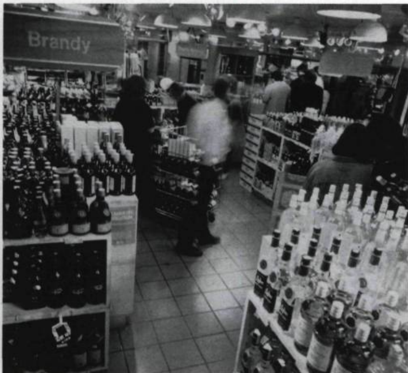
Aujourd'hui, plusieurs succursales de la Société des alcools du Québec ont l'allure de véritable boutiques spécialisées. Décor, étalages et services, tout est mis en œuvre pour se rapprocher davantage de la clientèle. Photo fin de 1994.

nouvelles approches et de nouveaux outils de commercialisation afin de s'adapter aux habitudes de vie de sa clientèle et aux tendances du marché. Ainsi, après avoir mené une enquête auprès de sa clientèle, elle adoptait récemment un nouveau concept de bannières pour ses succursales. Composé de succursales SAQ Express, SAQ Classique et SAQ Sélection, ce nouveau concept permettra d'ici trois ans d'harmoniser chacun des points de vente avec les besoins de sa clientèle.