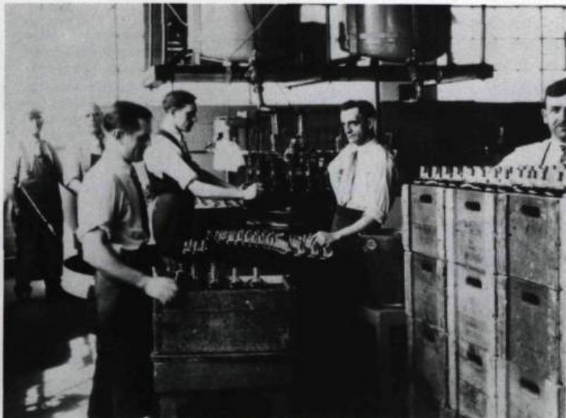
Embouteillage des spiritueux à la Commission des liqueurs de Québec.