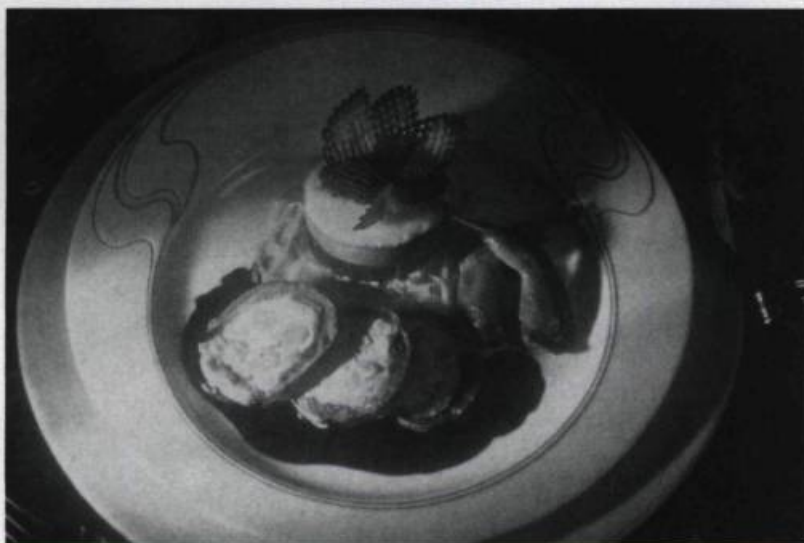
Quelques plats illustrant la «nouvelle cuisine québécoise».