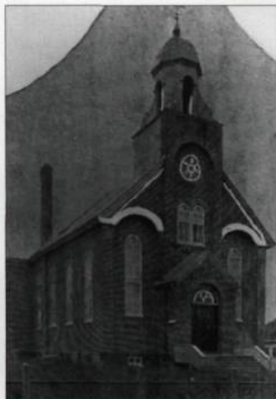
Église de Saint-Zéphirin-de-Stadacona. (Archives de la Ville de Québec; collection iconographique, N-010680).

transept. En effet, le chœur surélevé, mis en évidence dans le film d'Alfred Hitchcock La loi du silence en 1953, a été réalisé selon les plans de l'architecte Adalbert Trudel entre 1917 et 1918.