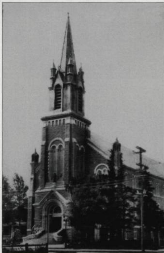
Deuxième église de Saint-Charles ouverte au culte en 1901 et incendiée en 1916. Photographie, 1910. (Archives de la paroisse de Saint-Charles de Limoilou).