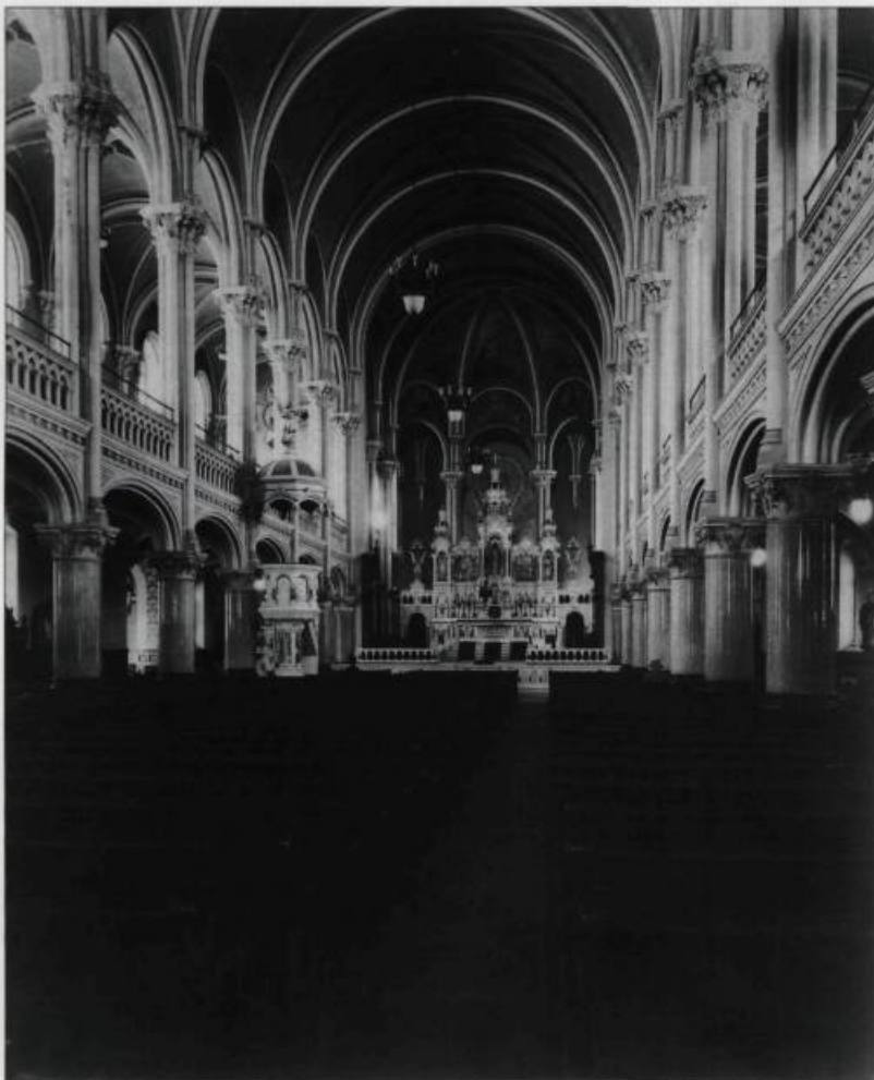
Intérieur de l'église de Saint-Charles avant 1932.

C omme ailleurs au Québec, l'architecture culturelle de Limoilou a connu au cours du XX e siècle des transformations majeures liées à la migration des populations rurales vers les villes, à la division des paroisses en milieu urbain, à la crise économique de 1929 et à l'avène-