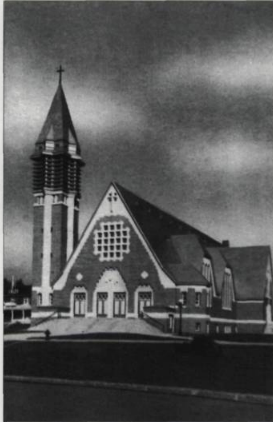
Église de Saint-Pascal-de-Maizerets.

reste empreinte de tradition : la charpente de métal est recouverte. Les nouveaux matériaux et les nouvelles technologies sont introduits par Rousseau, mais contrairement à l'abbé Nadeau, qui cherche à faire naître les formes de leur emploi, l'architecte les incorpore, tout en conservant les habitudes de construire alors en usage. Comme le souligne l'historien de l'art Jacques Robert, il faudra attendre les années 1935 et plus particulièrement la construction de