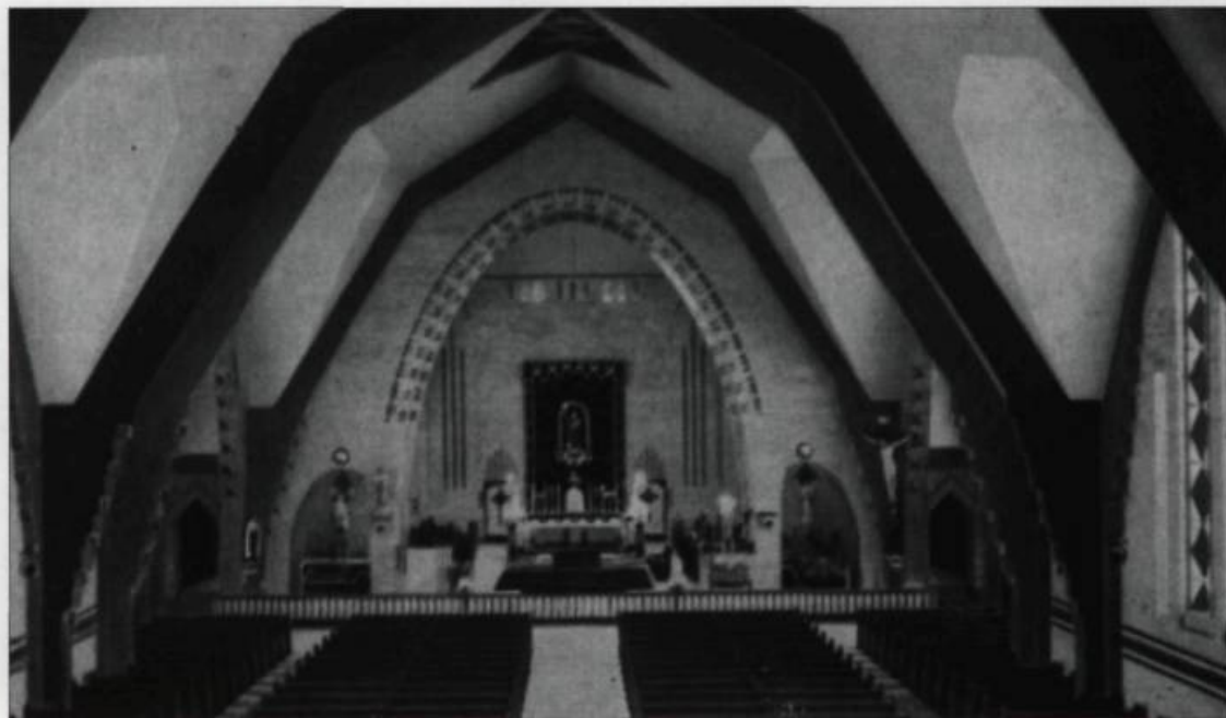
Intérieur de l'église de Saint-Pascal-de-Maizerets. Carte postale de Lorenzo Audet vers 1955. (Collection Yves Beauregard).

Les propos tenus par l'élite cléricale dans les journaux de Québec, aux différentes étapes de construction de l'église de la paroisse Saint-François-d'Assise, nous apparaissent révélateurs