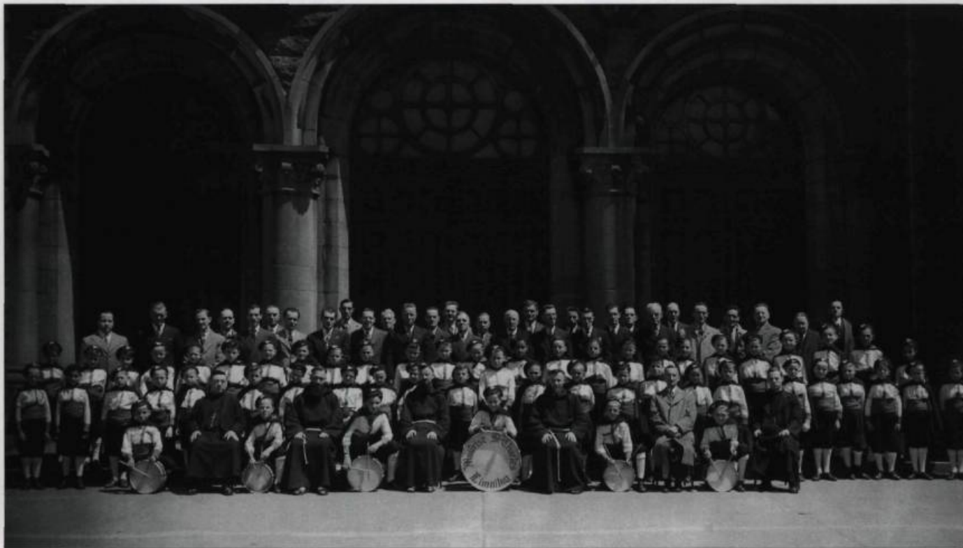
La chorale en mai 1945.

Grâce à leur ténacité, les capucins réussirent à contrôler les finances et à dégrever la paroisse de ses dettes. En 1945, les hypothèques étaient levées. On réussit même pour le cinquantenaire à restaurer l'église, en perçant deux verrières