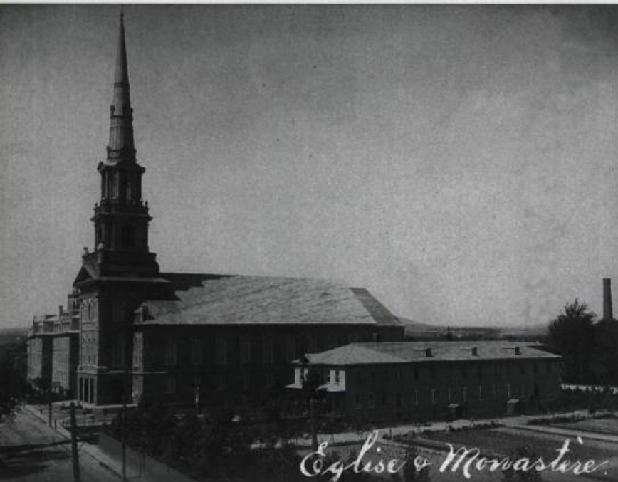
Église de Saint-Charles et le couvent des capucins à sa droite. Ce dernier édifice a été construit en 1903 en incluant le presbytère de 1898.

Les capucins de Limoilou appartiennent à la grande famille de l'ordre des Frères mineurs fondé au XIII e siècle par François d'Assise. En 1525, un religieux de cet ordre, Mathieu de Basci, obtint du pape l'autorisation de s'appliquer à