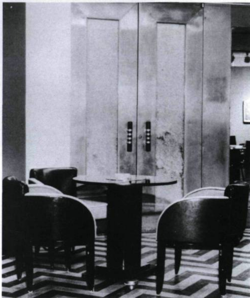
Fumoir de la salle à manger du restaurant le 9 e chez Eaton en 1976.

l'on trouvait sur les paquebots de croisière de l'entre-deux-guerres. À cette fin, l'architecte Jacques Carlu s'est inspiré de la salle à manger de l' Île-de-France , lancé par la compagnie française French Line en 1927. Le trait d'union entre