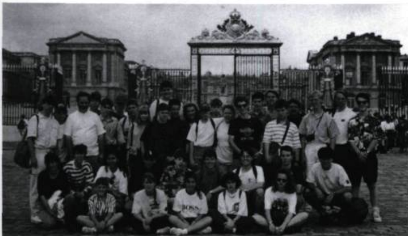
L'Orchestre d'harmonie senior, en voyage en France, pose devant la grille du château de Versailles. («L'Abeille», vol. 39, n° 2, automne-hiver 1993).

Les cuivres et les bois sont naturellement à l'honneur, pour alimenter la Société Sainte-Cécile. Gare aux oreilles sensibles, si l'on en juge par ce commentaire de Joseph-Edmond Roy, pensionnaire entre 1867 et 1877: La musique instrumentale, placée aux heures de récréation, est cultivée avec peut-être trop d'ardeur. C'est à dire que le Canadien, comme ses pères les Français, aime le bruit, surtout le bruit cadencé [...] .