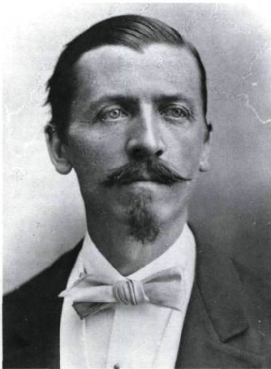
Antoine Dessane naît en France en 1826 et fait ses études musicales au Conservatoire de Paris.