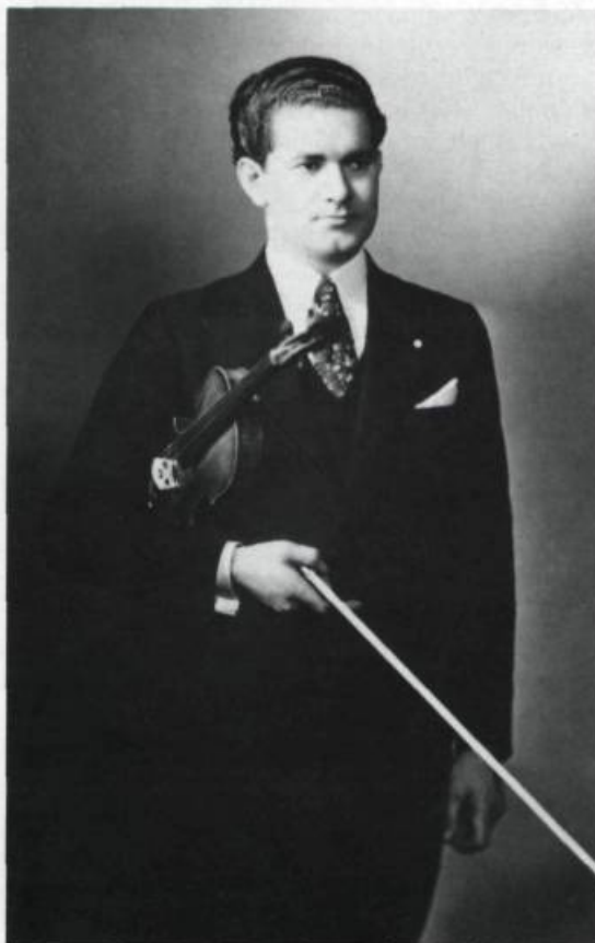
Le célèbre violoniste Arthur LeBlanc étudie au Petit Séminaire de Québec de 1914 à 1923. En 1945, il est la vedette d'un concert donné à la Salle des promotions en l'honneur de l'abbé Chrysologue Desrochers.