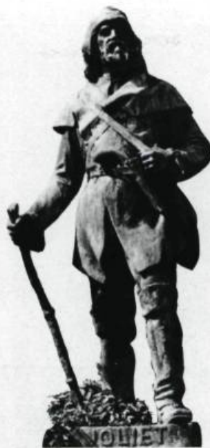
Louis Jolliet (1645-1700), formé au Petit Séminaire de Québec ainsi qu'en France, aura un bagage musical suffisant pour pouvoir toucher l'orgue de Notre-Dame-de-Québec entre ses diverses explorations du continent et même montrer à en jouer à plusieurs personnes de son «alma mater». Sculpture de Marc-Aurèle de Foy Suzor-Côté, façade de l'hôtel du Parlement, 1928.

Divers documents du début du XVIII e siècle laissent entendre que «Messieurs du Séminaire» confieront au chapitre de la cathédrale le soin de former les jeunes gens et ecclésiastiques dans notre église et pour le chant et pour les cérémonies sans qu'il leur en ait jamais coûté un sol [...] Ils n'ont même pas fourni les livres de chant pour faire chanter et apprendre les séminaristes. En retour, Notre-Dame-de-Québec pourra compter sur quatre chantres rétribués et sur six enfants de chœur bien réglez , venant du Petit Séminaire. Quelques noms nous sont parvenus: