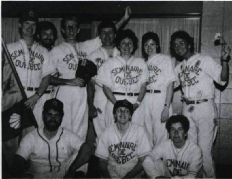
La participation des enseignants au Défi à l'entreprise 1987 montre la présence de professeurs féminins au Petit Séminaire. Le groupe porte, sur cette photographie, le survêtement sportif des années 1950. («L'Abeille», vol. 34, n° 2, été 1987).

versité, le Petit Séminaire utilise, après restauration, deux salles sous les combles du vieux Séminaire. Tout est concentré maintenant au cinquième étage du pavillon de la rue Sainte-Famille. L'école maintient ce qu'elle estime être une caractéristique institutionnelle: réunir, pour étudier dans une même salle, jusqu'à 217 jeunes. Et pourtant, ces jeunes ont souvent leur bureau dans leur propre chambre; à l'heure de l'ordinateur, on continue à vivre en grand groupe.