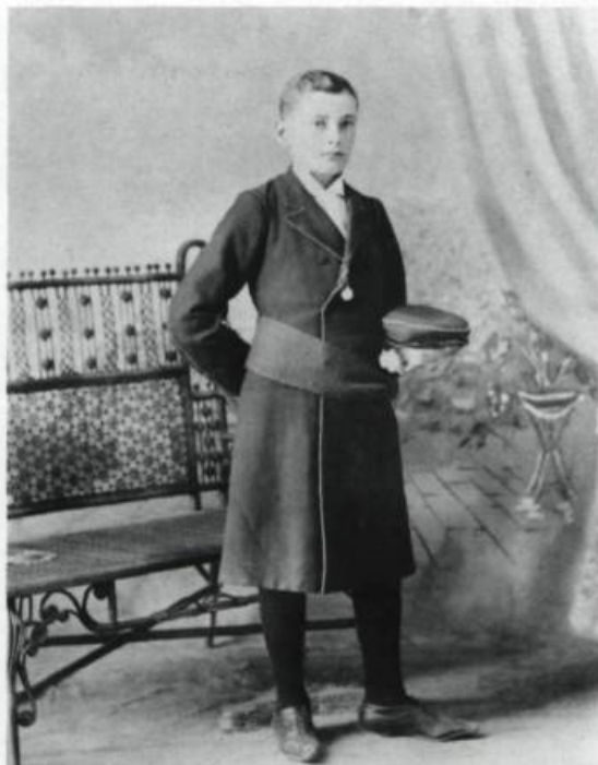
Le «suisse» sera le costume officiel du Petit Séminaire de Québec jusqu'en 1943. Il sera alors remplacé par le «blazer». Photo de A.-R. Roy, 1897 et photo anonyme, 2 juin 1956. (Archives du Séminaire de Québec).

Dans les classes de grammaire, soit les quatre premières années, on fait surtout des langues mortes et du français. Le latin est enseigné sans les ménagements d'aujourd'hui. Des thèmes et des versions qui nous promènent en compagnie d'Ulysse ou d'Achille nous aident un peu à digérer les déclinaisons et les conjugaisons. En Rhétorique, on saura assez de latin pour traduire Tacite à coups de dictionnaire mais pas assez pour faire des vers latins comme au temps d'écolier de l'ancien cardinal-archevêque de Québec,