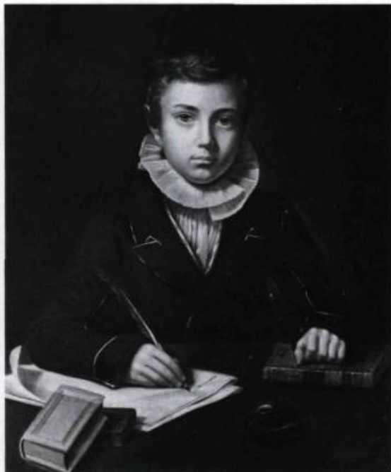
Dans la foulée de la réforme entreprise par Jean Holmes et Jérôme Demers se distingue un futur généalogiste de renom, Cyprien Tanguay. Œuvre d'Antoine Plamondon, 1832. Photo: Pierre Soulard. (Musée du Séminaire de Québec).

dans la classe de physique, elles constituèrent dès 1785 un cours complet de mathématiques pures et appliquées, qui regroupait plusieurs parties de la physique.