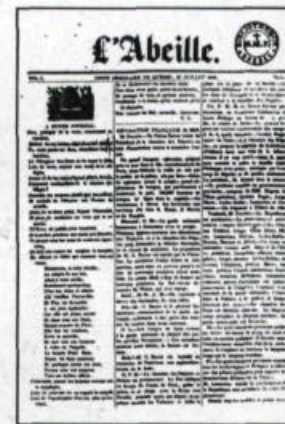
Premier numéro du journal «L'Abeille» fondé par les étudiants du Petit Séminaire en 1848. (Bibliothèque du Séminaire de Québec).

Toutes ces modifications dans les pratiques pédagogiques tendaient à améliorer la qualité des études et les élèves étaient les premiers à en bénéficier. Demers, Holmes et les autres prêtres leur étaient entièrement dévoués. Demers montrait pour sa part la plus grande bonté dans ses rapports avec les jeunes, sachant que la vie quotidienne au Séminaire était dure et l'année fort longue loin des parents. C'est ainsi que les vacances d'été furent avancées du 15 août au 15 juillet en 1835 et qu'il ne fut plus obligatoire d'aller passer des vacances au Petit Cap. On comprend donc mieux pourquoi les noms de Demers et de Holmes ont été inscrits dans la charte de fondation de l'Université Laval en 1852. ♦