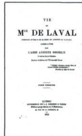
Parue en deux tomes en 1890, cette nouvelle biographie rédigée par l'abbé Auguste Gosselin va contribuer à la cause de M gr de Laval à Rome. Le 24 septembre 1890, Léon XIII lui confère le titre de «Vénérable»..

Les nécessaires restaurations de la cathédrale de Québec, constatées à la fin du XIX e siècle, devaient avoir une incidence directe sur la place que l'historiographie ferait à François de Laval. L'exhumation qu'entraînaient les travaux éveilla un nouvel intérêt; le Séminaire décida de faire un procès de canonisation. L'Église «triomphante», qui émergeait des sombres lendemains de la Conquête, sentait de plus en plus le besoin d'asseoir l'histoire de l'Église du Canada sur des bases aussi solides que celles des autres grandes Églises; comme celle du diocèse de Paris qui se rattache à saint Denis, celle de Lyon qui est l'œuvre des saints Photin et Irénée ou celle de Rouen qui fut fondée par saint Nicaise, l'Église de Québec aussi était vénérable malgré sa jeunesse. Dès lors, toute l'œuvre historique témoignait de la vertu du fondateur. L'historiographie de langue anglaise suivit également ce courant. Par exemple, donnant crédit aux mémoires de la