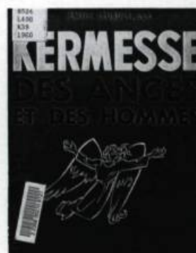
En 1959, le tricentenaire de l'arrivée de François de Laval est souligné par une pièce de théâtre du père Émile Legault. Kermesse des anges et des hommes fut présentée au Colisée de Québec. (Bibliothèque de l'Université Laval).