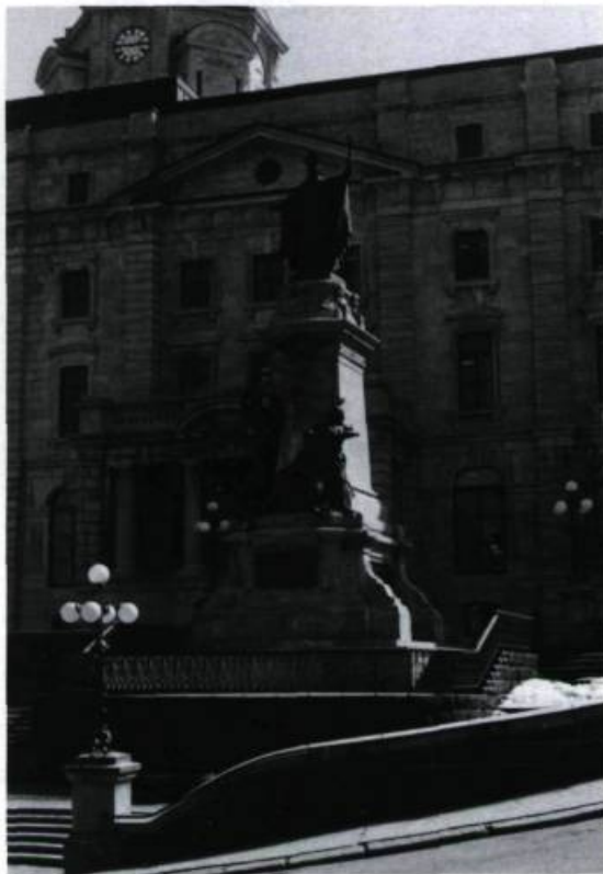
Le monument Laval s'élève derrière la basilique Notre-Dame, à la rencontre des rues Buade et Port Dauphin, au sommet de la côte de la Montagne.

Le monument se compose d'un socle en granit de Stanstead, qui porte la statue de l'évêque. La face principale du soubassement est ornée d'une inscription, alors que l'arrière et les côtés offrent des bas-reliefs historiés.