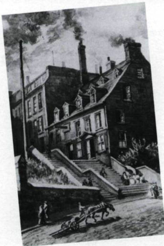
Le site du monument Laval tel qu'il apparaissait avant 1908. Une agglomération de maisons irrégulières occupait l'emplacement. (C.W. Jeffery, 1889.).

La cérémonie du dévoilement eut lieu le lendemain, 22 juin, à 15 heures. Une messe pontificale avait été célébrée le matin dans la chapelle du Séminaire. Les murs de l'hôtel des postes, du presbytère et de l'archevêché étaient ornés de drapeaux et d'inscriptions, alors que les abords du monument étaient ornés de verdure. Un chœur de 600 voix fut mis à contribution; il exécuta entre autres une Cantate en l'honneur de monseigneur de Laval d'après un texte d'Octave Crémazie. Après l'allocution du président du comité, L.P. Sirois, le gouverneur général du Canada, Lord Grey, procéda au dévoilement en présence d'une foule estimée à 50 000 personnes. François de Laval voyait ainsi son œuvre consacrée par l'histoire. ♦