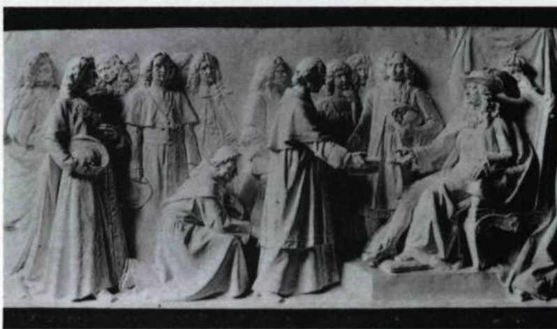
Maquette du monument de François de Laval vers 1907. Cartes postales de l'éditeur Neurdein, Paris.