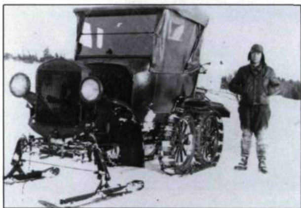
△ Différents prototypes de l'autoneige imaginés par J.-A. Bombardier. (Musée Bombardier, Valcourt).